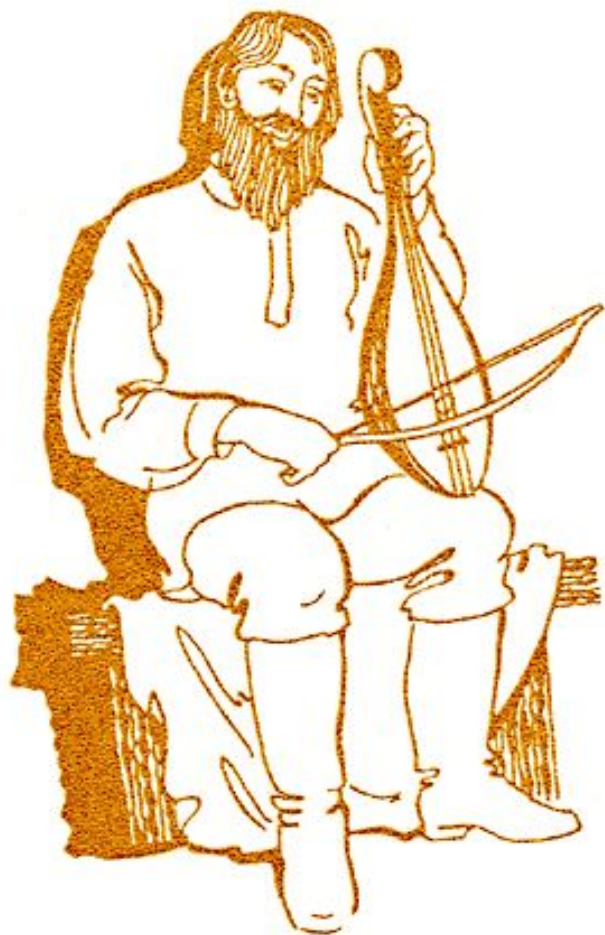
Игра на гудке