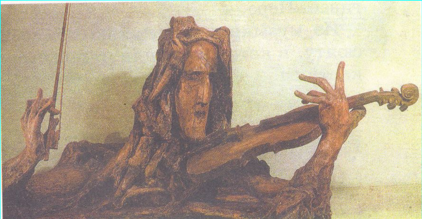
С. Коненков «Паганини»