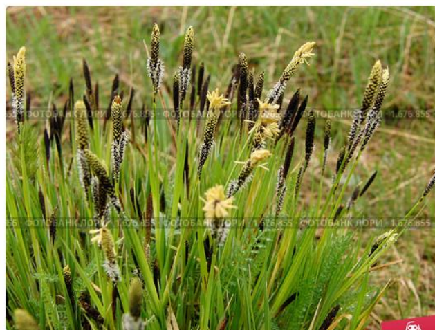
Осока черная