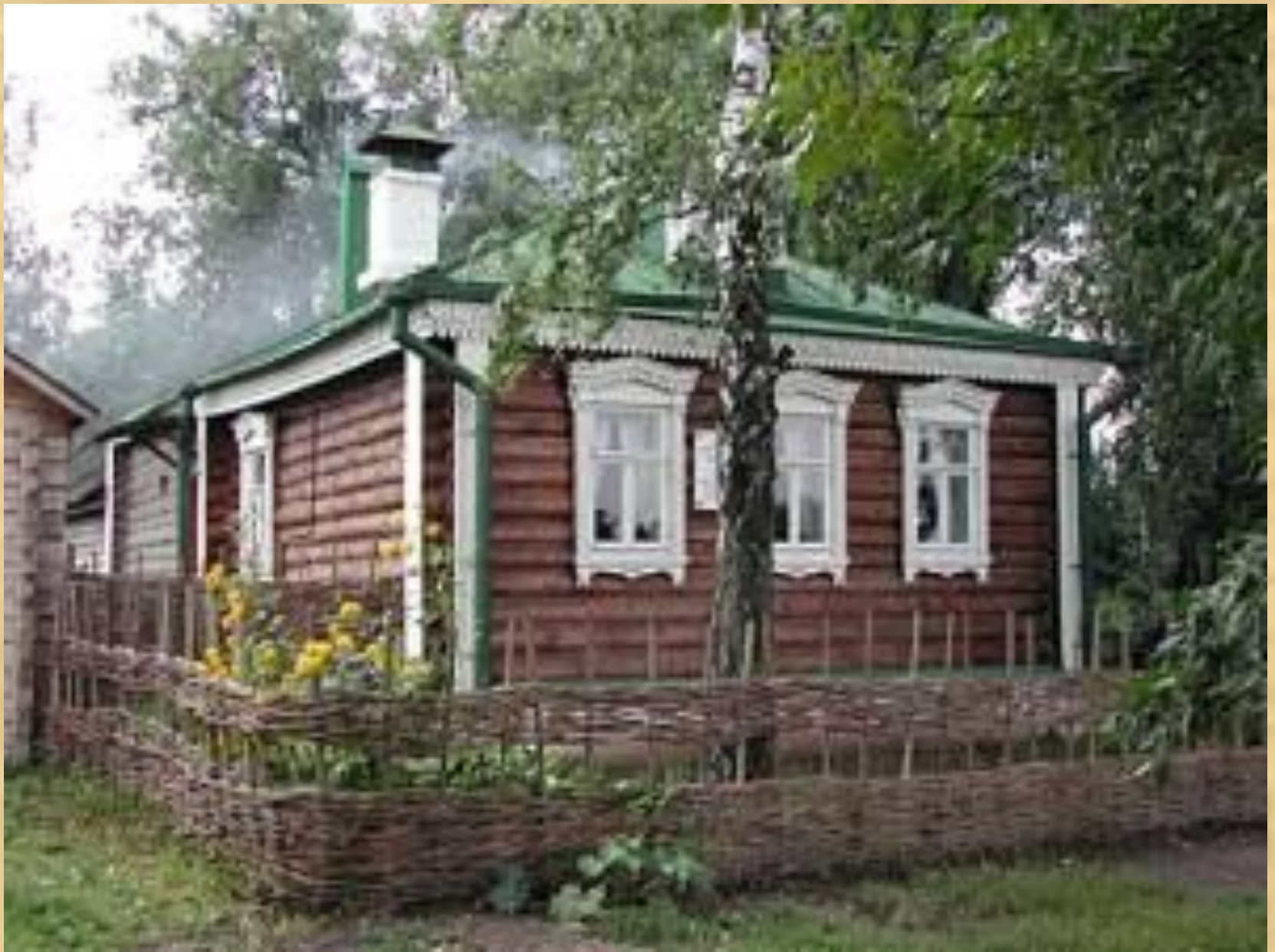
Дом родителей С. Есенина