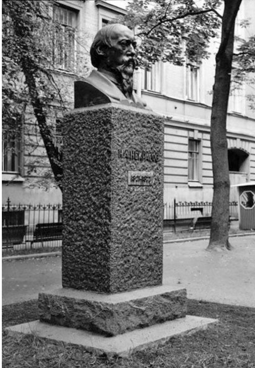
Бюст Некрасова на литейном проспекте в Санкт-Петербурге. Скульптор В.В. Лишев. 1922 год