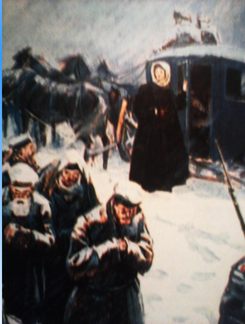
Д.Шмаринов. Иллюстрация к поэме Некрасова «Русские женщины»

Начало 1870-х гг. Творчество поэта отмечено, усилением значения гражданской тематики. Поэма «Русские женщины», посвященная судьбе декабристов и их женам, вначале называлась «Декабристки». Героиня поэмы, Екатерина Ивановна Трубецкая, была первой из жен декабристов, добившейся у царя разрешения последовать за мужем в сибирскую ссылку.