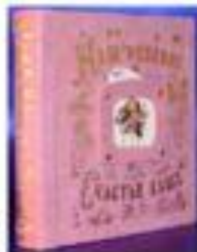
Детский подарочный альбом