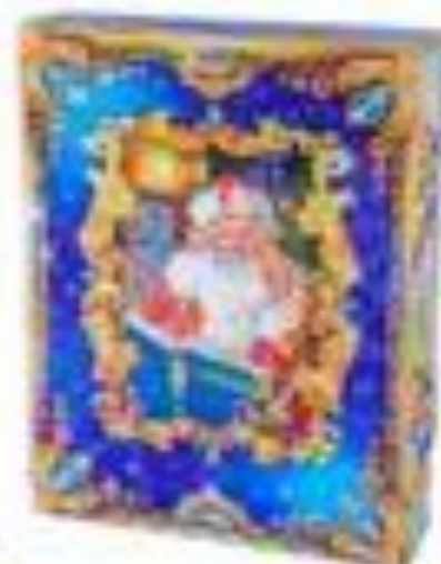
Новогодний подарок. Книга сказок