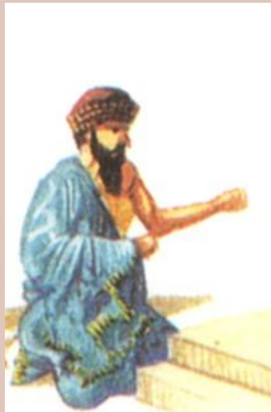
Человек убивший вола