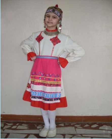
Национальный чувашский костюм