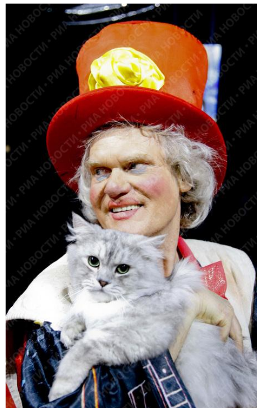
Юрий Куклачев – руководитель и основатель Театра Кошек