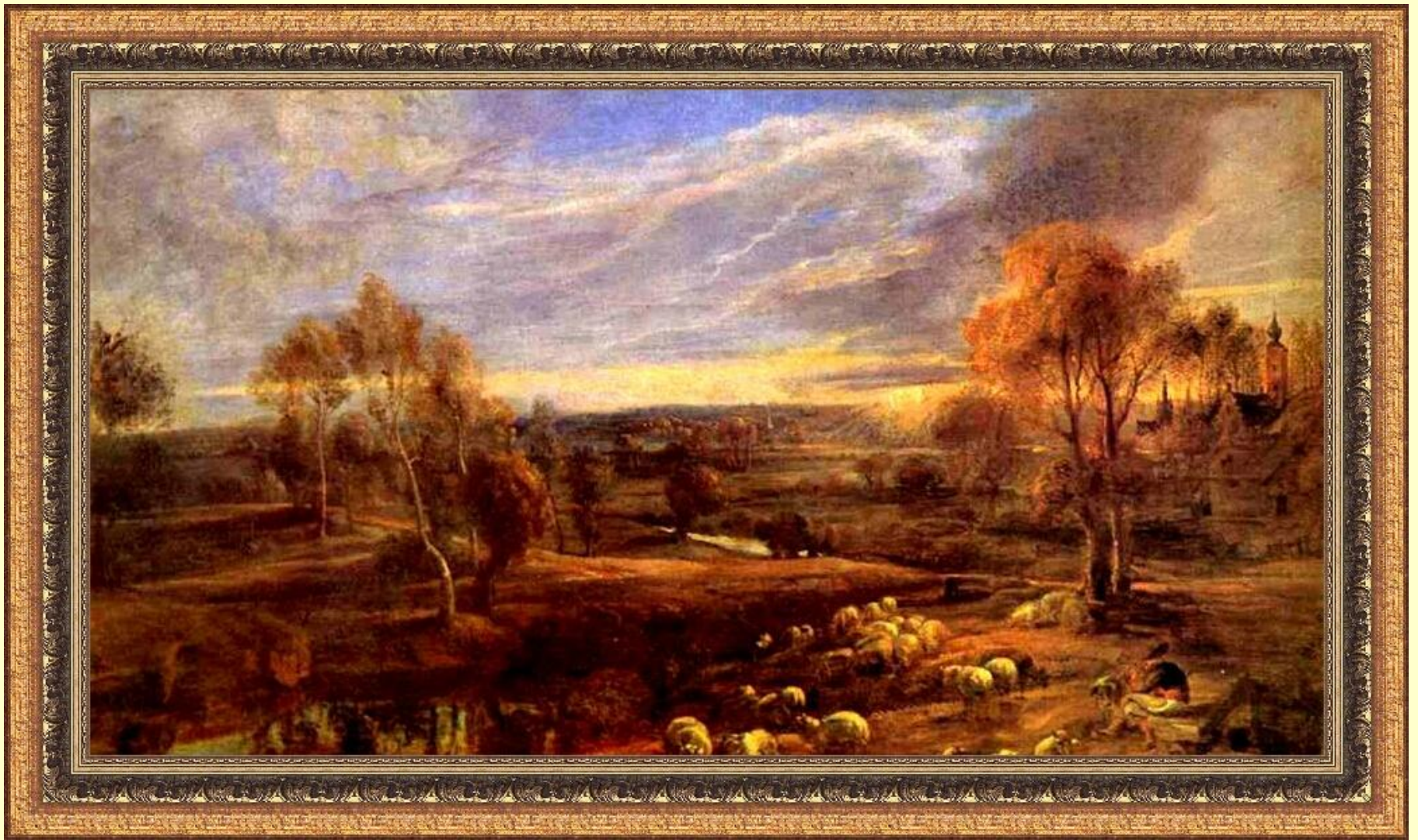
Пейзаж с заходящим солнцем