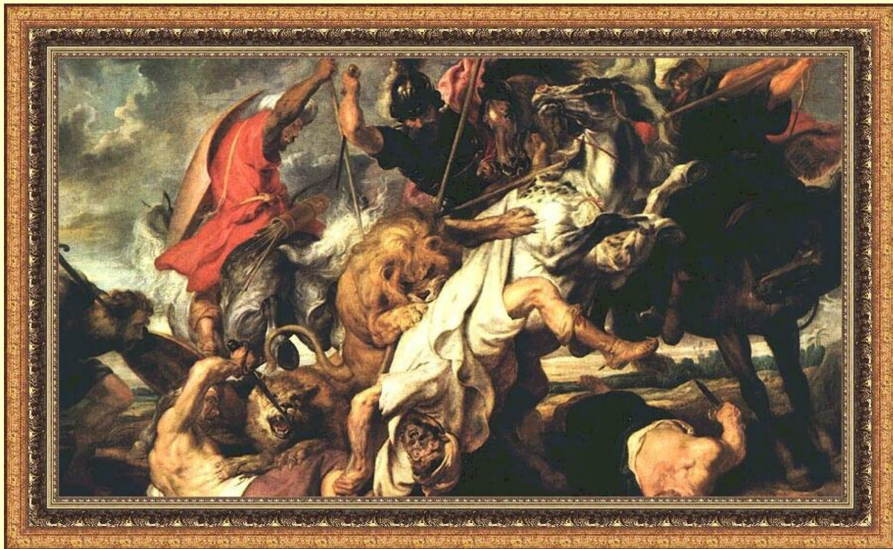
Охота на лъва