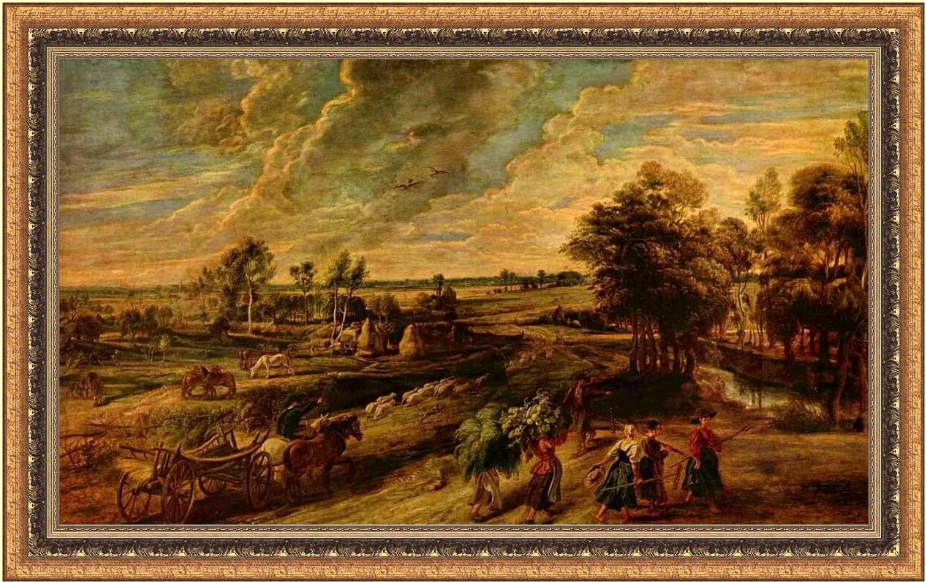
Возвращение крестьян с поля