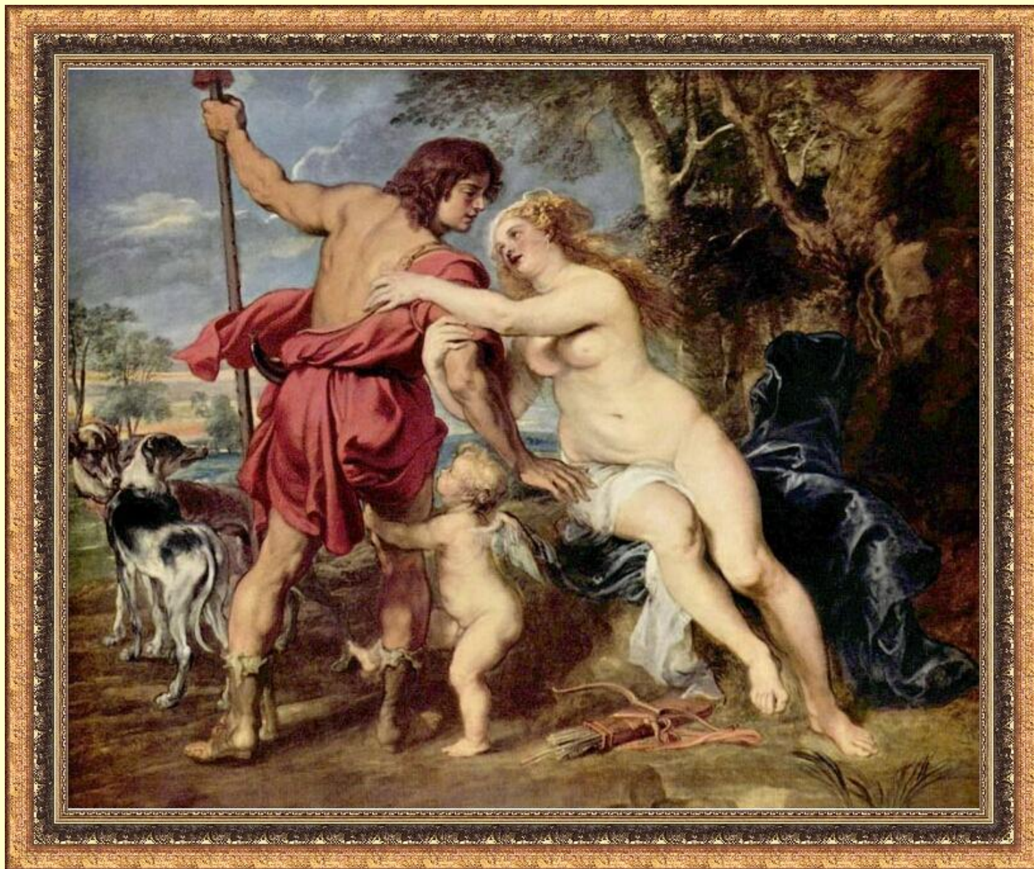
Венера и Адонис