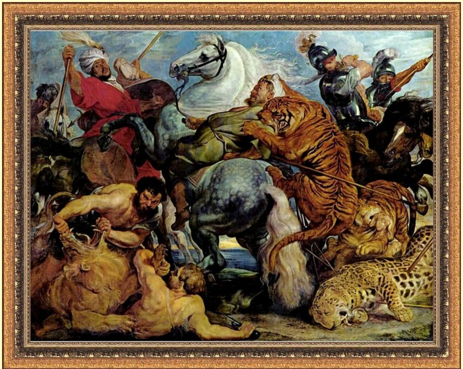
Охота на тигров и львов