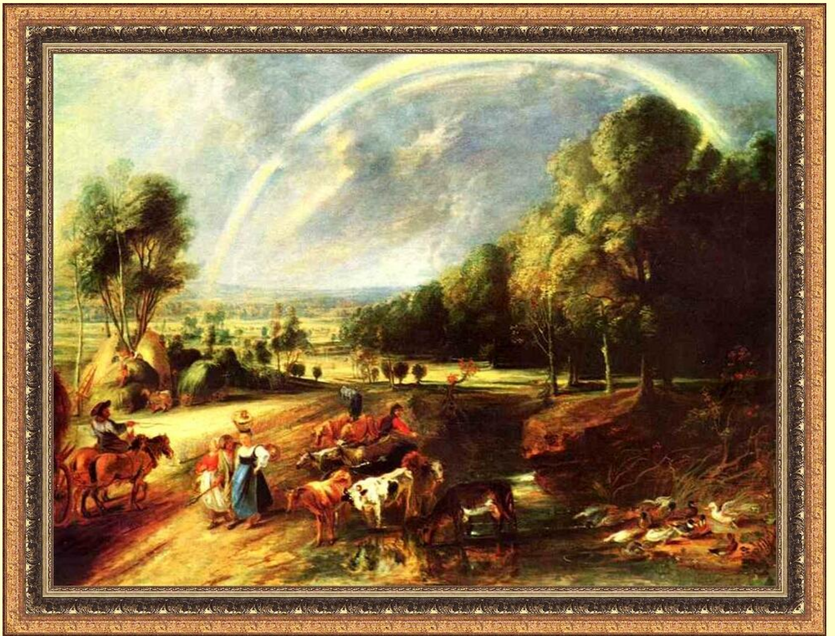
Пейзаж с радугой