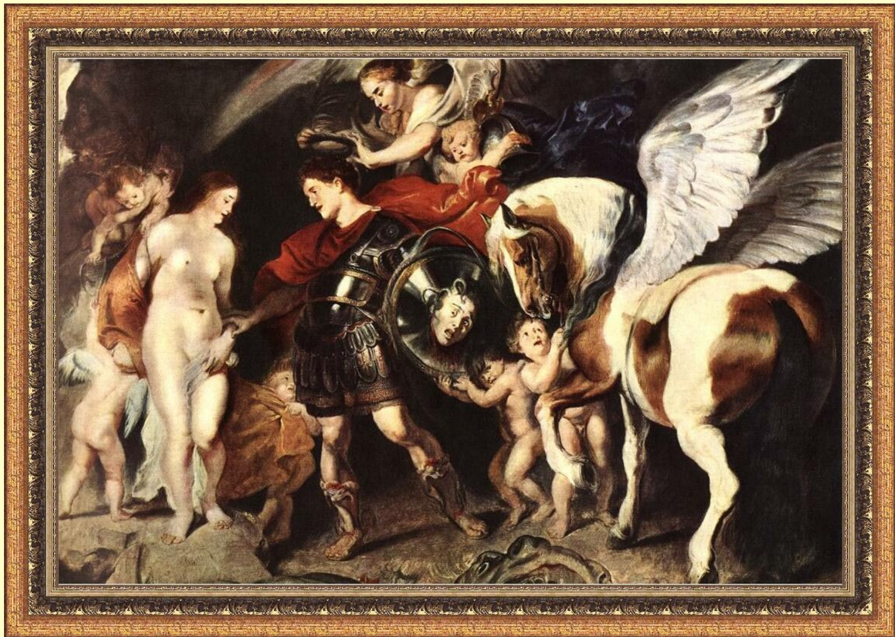
Персей и Андромеда