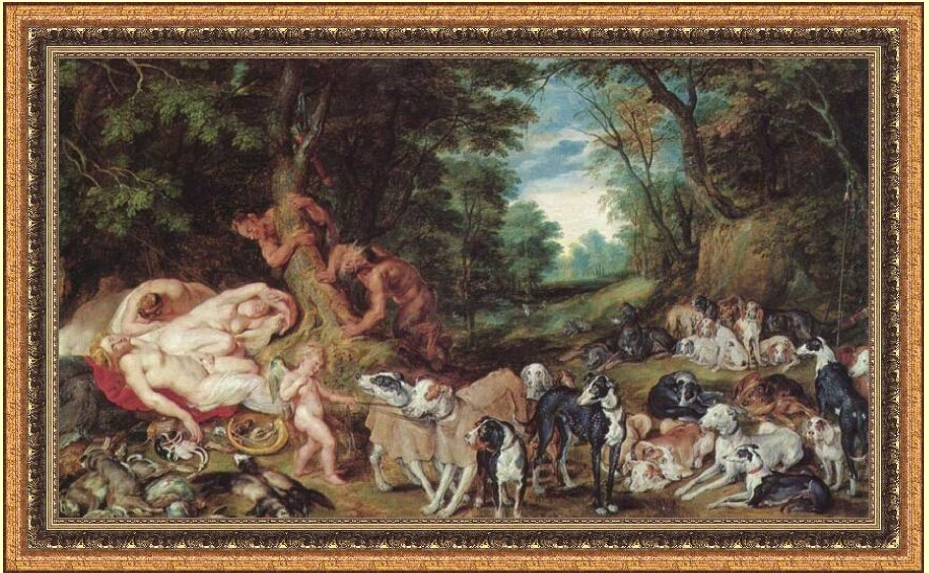
Нимфы, сатиры и собаки