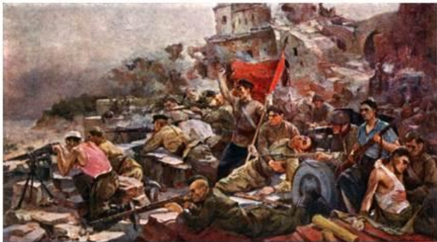
Е Зайцев. Оборона Брестской крепости.

Около месяца продолжалась героическая оборона. Ничто не сломило волю и мужество гарнизона.