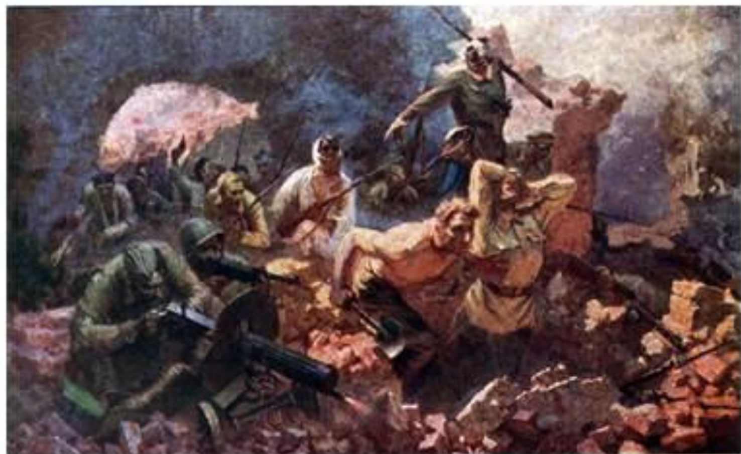
Е.Зайцев. «Оборона Брестской крепости в 1941 году»

До последнего сражались бойцы. Об этом говорят надписи на стенах крепости: «Прощай, Родина! Умрём, но не сдадимся!»