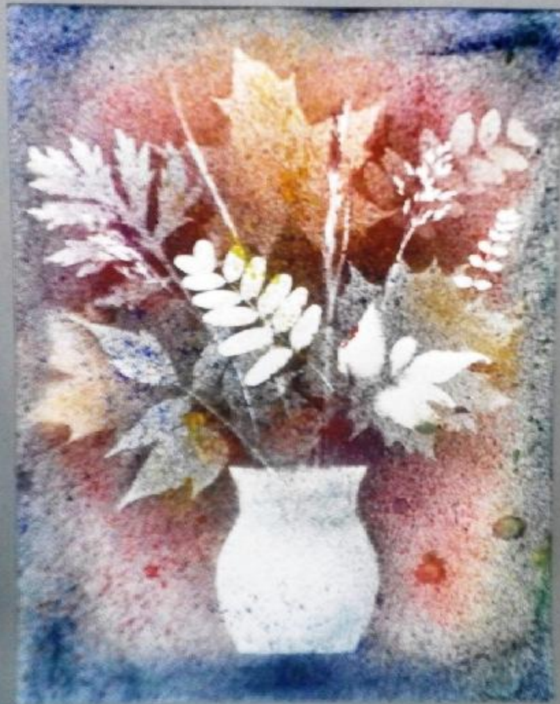
Осенний букет Набрызг

«Набрызг» или рисование брызгами — это несложная и интересная техника для творчества