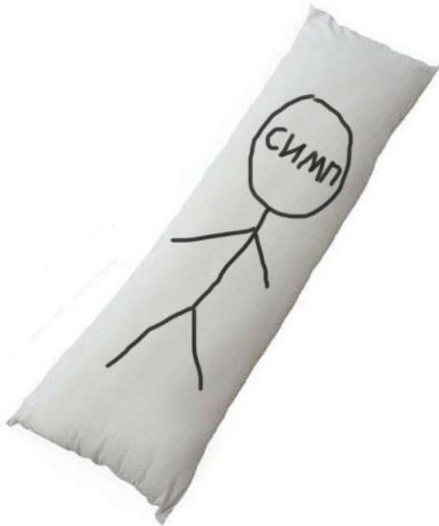
Референс самой дакимакуры и её «принта»