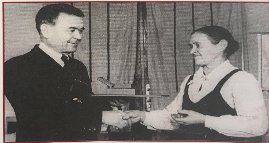
Вручение правительственных наград. Уфа. 1946 год, октябрь.