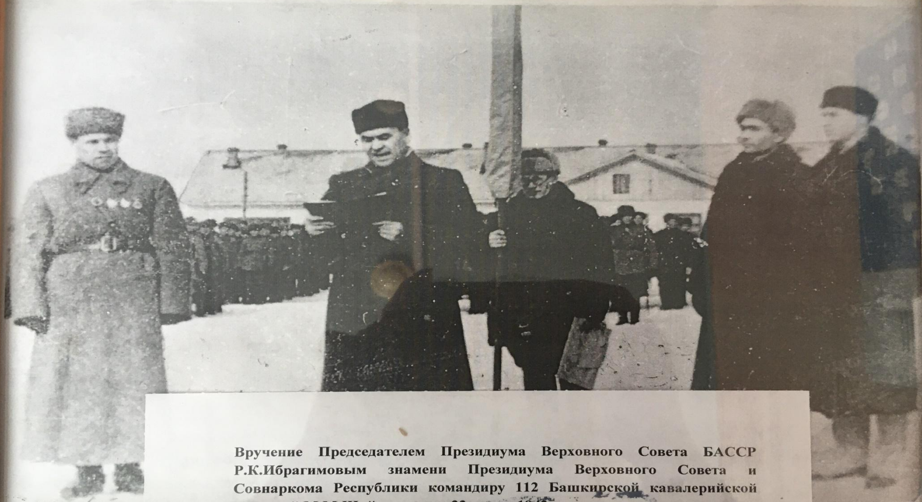
Вручение Председателем Президиума Верховного Совета БАССР Р.К.Ибрагимовым знамени Президиума Верховного Совета и Совнаркома Республики командиру 112 Башкирской кавалерийской дивизией М.М.Шаймуратову, 22 марта 1942 г.