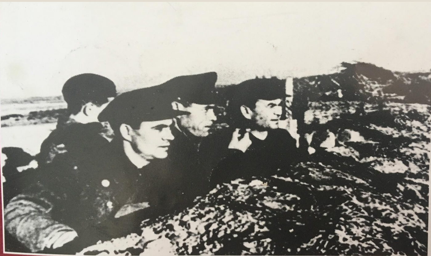
Делегация трудящихся Башкирии на фронте в 112-й Башкирской кавалерийской дивизии (на передовой).