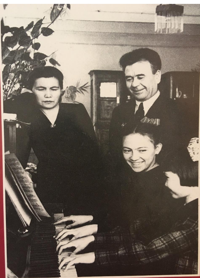
В кругу семьи.