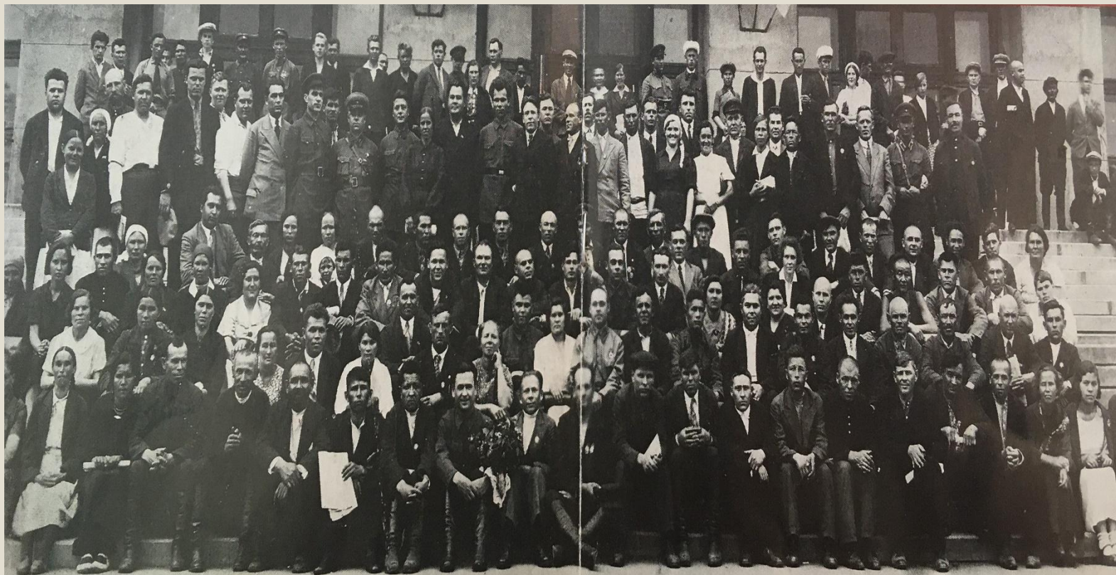
I сессия Верховного Совета БССР. 25-28 июля 1938 года.