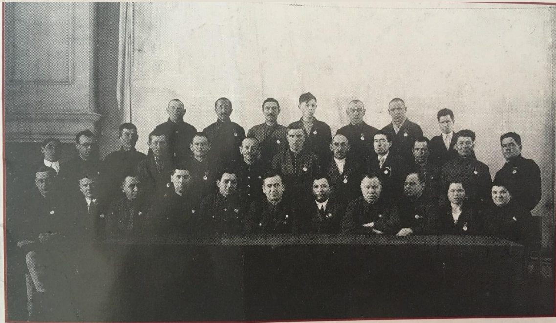
Группа награжденных работников БашАССР за выполнение задания правительства по лесной промышленности. 1943 год.