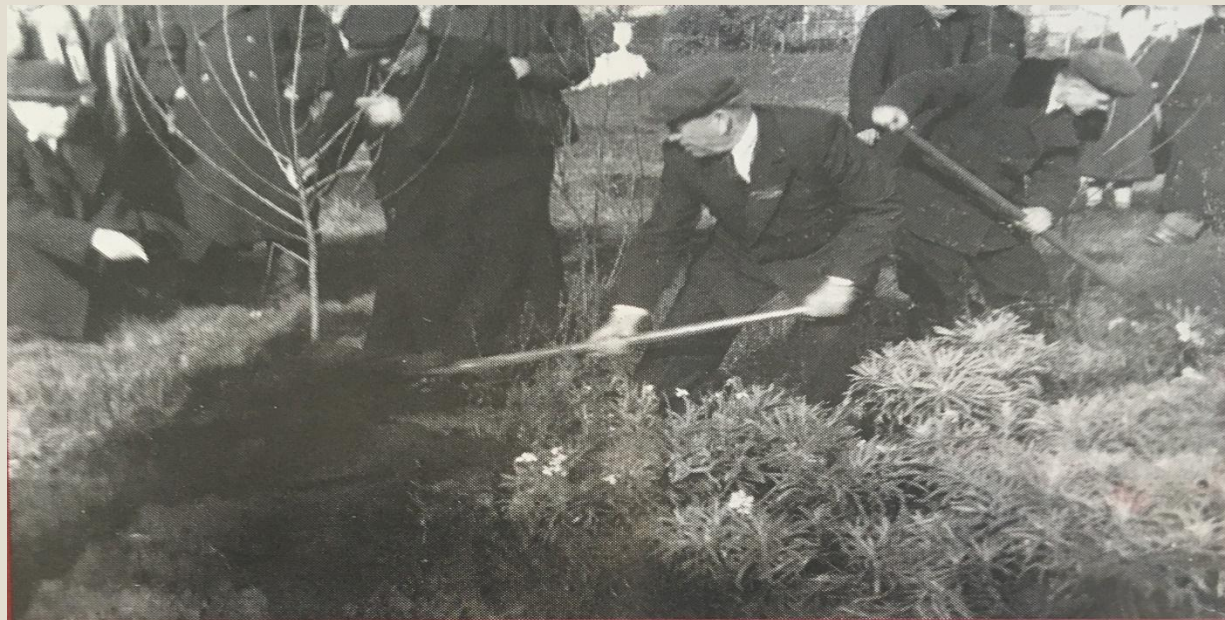
Закладка аллеи героям.