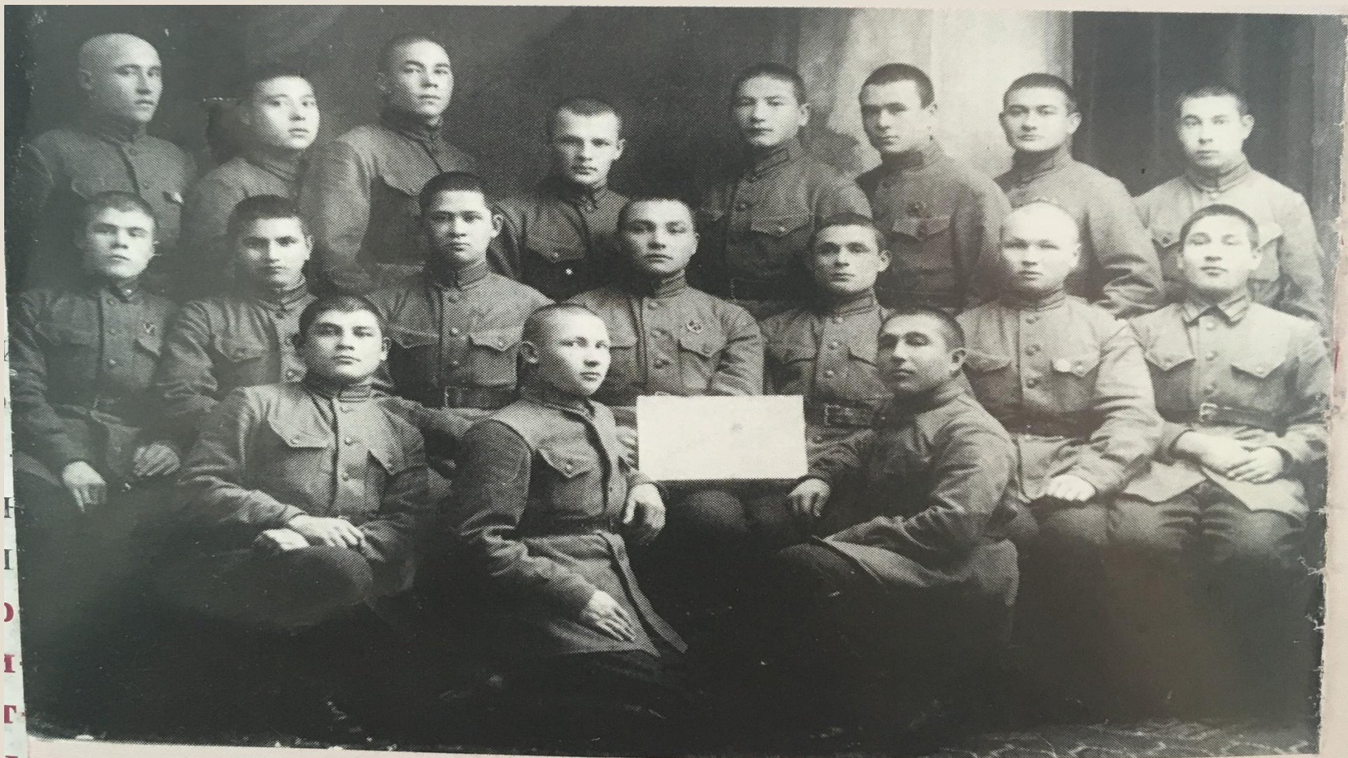
Объединенная татаро-башкирская военная школа в г. Казани. 1925-1929 годы.