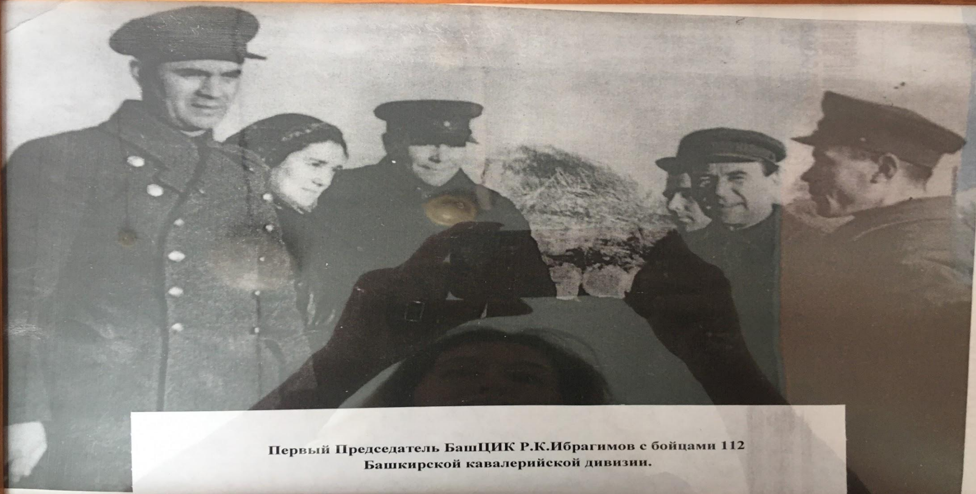
Первый Председатель БашЦИК Р.К.Ибрагимов с бойцами 112 Башкирской кавалерийской дивизии.