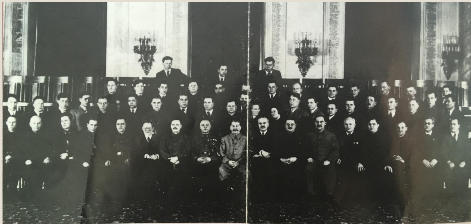
Делегаты XVIII съезда ВКП(б). Москва - Кремль. 22 марта 1939 года.