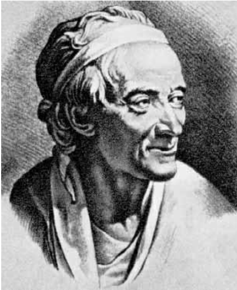
Вольтер - Voltaire