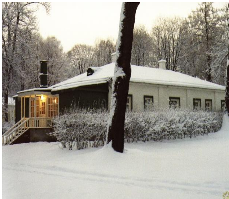
Флигель в Спасском, где жил Тургенев в ссылке.