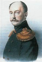
Император (1825–1855) Николай I