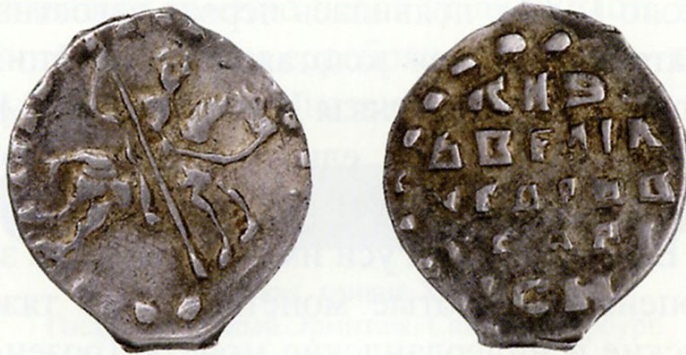
Копейка 1535–1538 гг.

При проведении реформы были унифицированы форма, вес монет, а также изображения и надписи на них