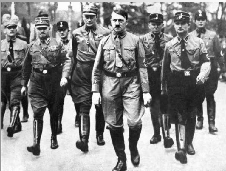
Гитлер во главе штурмовиков