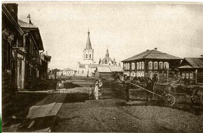
Гор. Мариинскъ, Томской губ. Никольская улица.