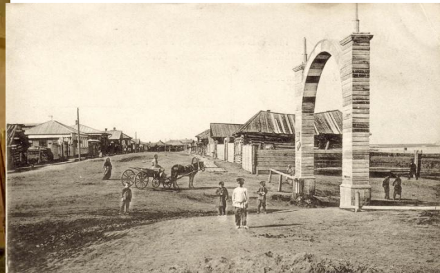
Гор. Мариинскъ, Томской губ. Набережная улица и арка.