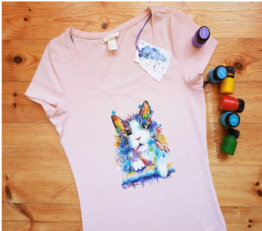
Футболка для девочки!