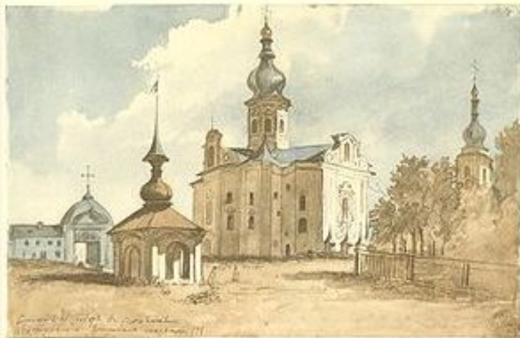
ВІД ВОЗНЕСЕНСЬКОГО СОБОРУ В ПЕРЕЯСЛАВІ Листопад 1845—січень 1846