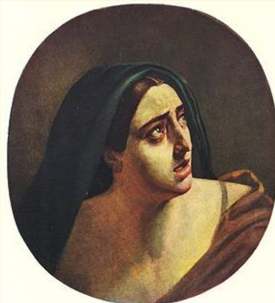
Г. ГОЛОВА МАТЕРІ. Олія. 1838—1840