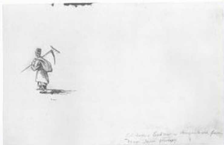
ВІД КОСАРА Листопад 1845—січень 1846

Зворот. Косар. Начерк. Селія, туш, перо.