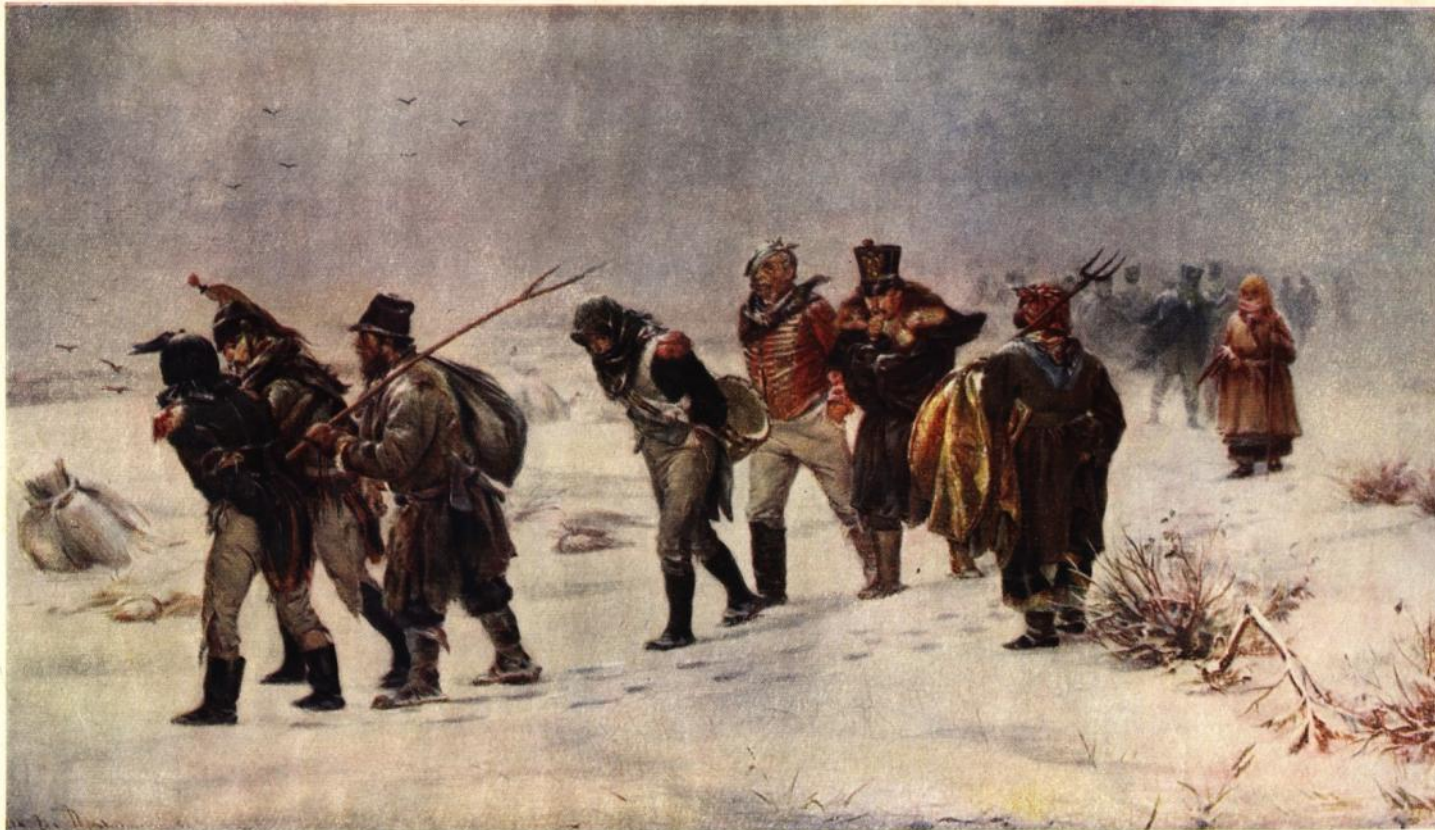
И. М. Прянишников (1840—1894)