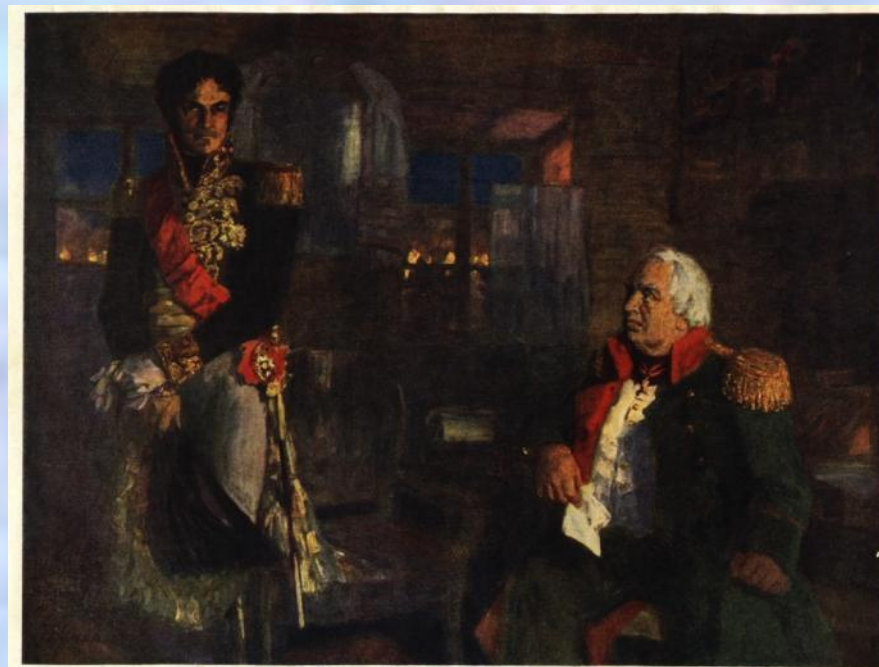
Н. П. Ульянов (1875—1949)