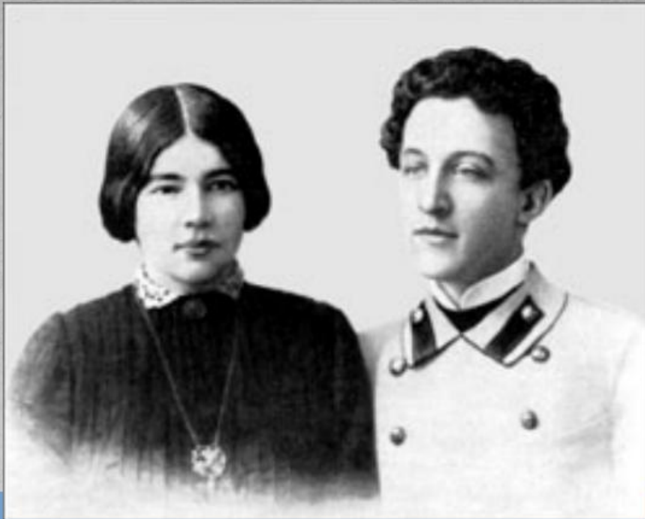
Любовь Дмитриевна Менделеева и Александр Александрович Блок