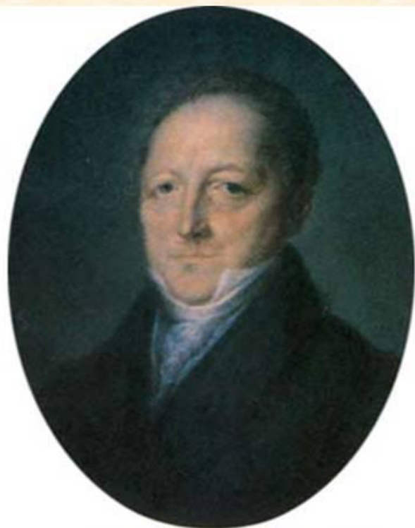
Отец Пушкина — Сергей Львович (1767—1848)