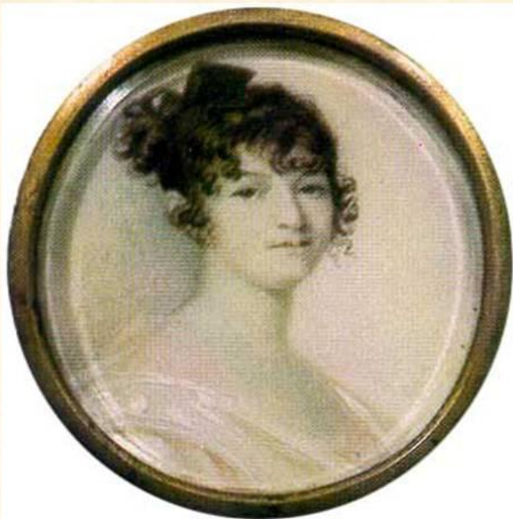
Мать Пушкина — Надежда Осиповна (1775—1836)

В СЕМЬЕ ПУШКИНЫХ БЫЛО ТРОЕ ДЕТЕЙ: ЛЕВ , АЛЕКСАНДР И ОЛЬГА. ВСЕ ДЕТИ БЫЛИ