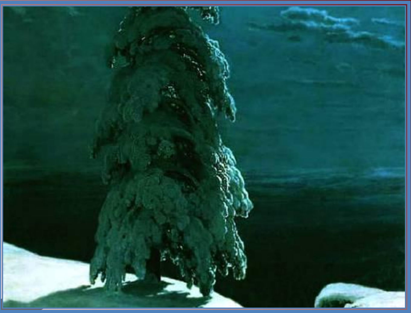
И.И.Шишкин «На севере диком...» (1890)