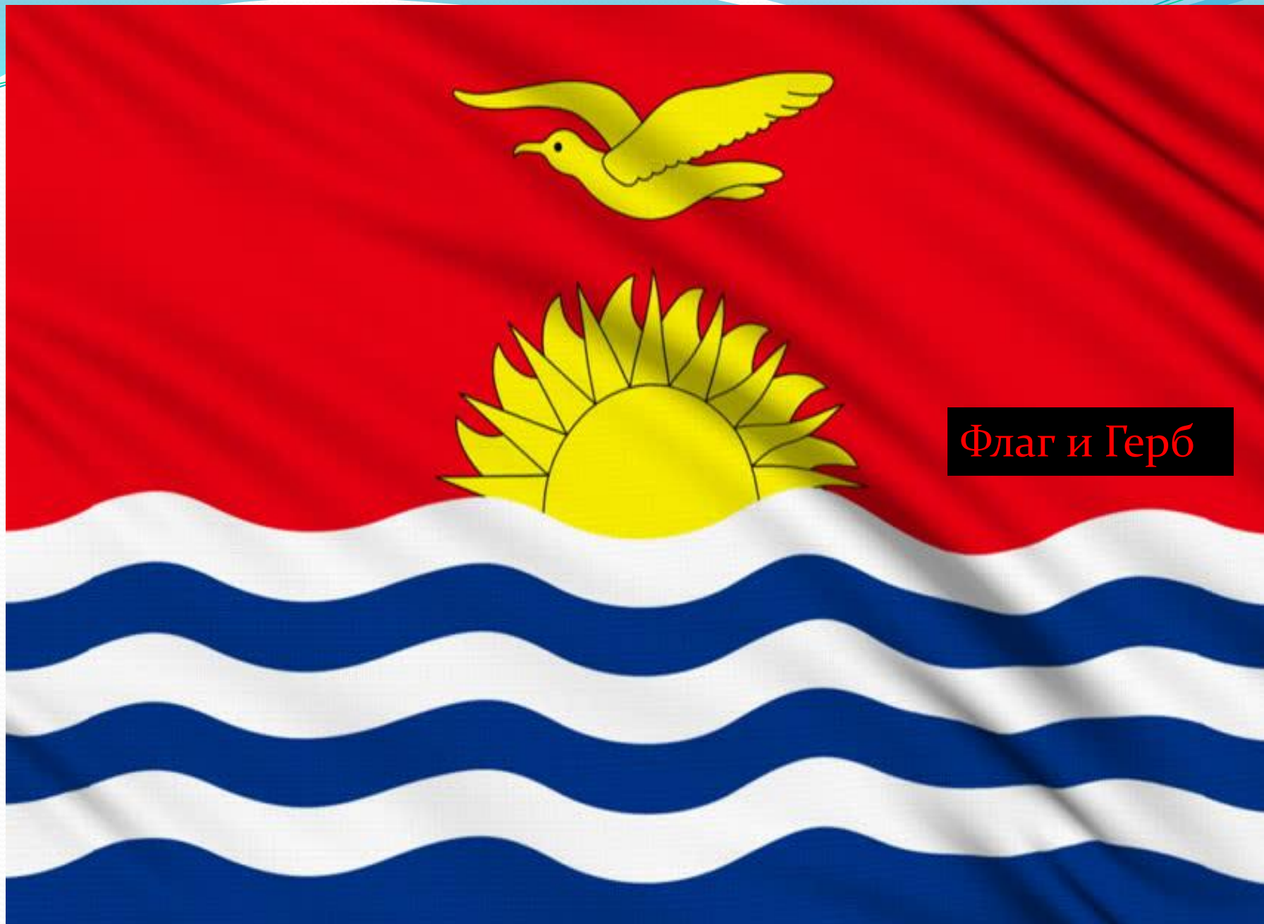
Флаг и Герб