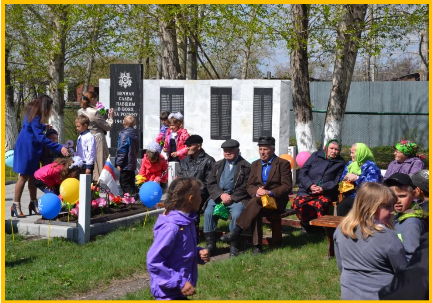
Встречи с ветеранами