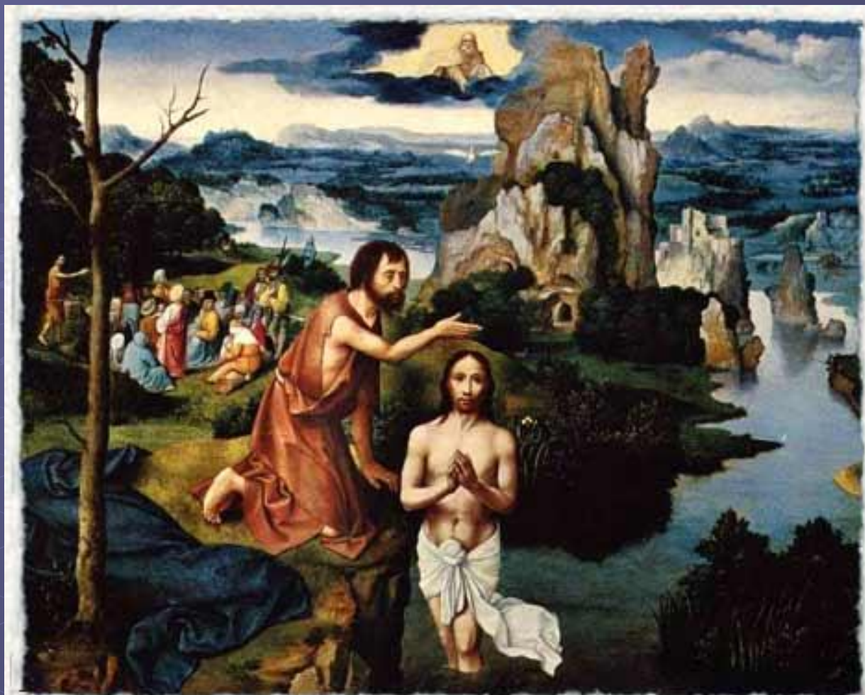
1515/1524 гг. Иоахим Патинир. Крещение Христово. Дерево, масло. 60x77 см. Вена, Музей истории искусств.

Когда Иисусу исполнилось 30 лет, он пришел на реку Иордан к Иоанну Крестителю, чтобы принять от него крещение.