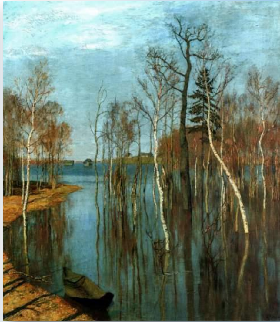
Исаак Левитан «Весна. Большая вода»