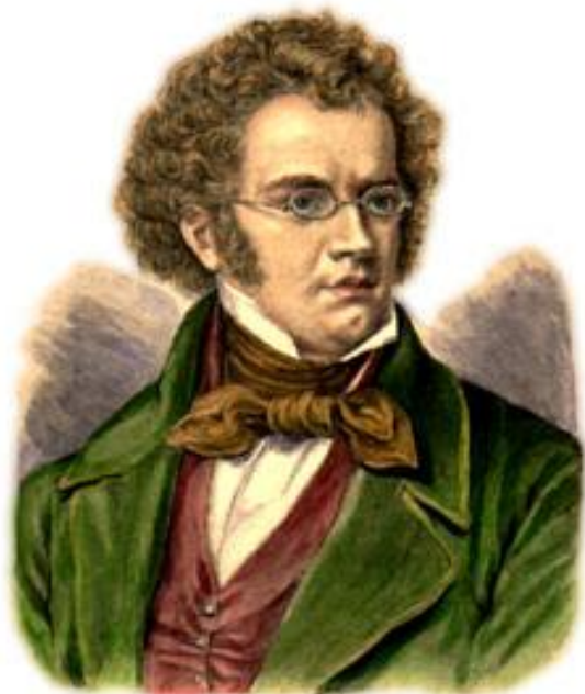
Franz Schubert um 1875

«Серенада» Шуберта из сборника «Лебединая песня», а также песни «Приют», «У моря» обрели мировую известность. Некоторые произведения, например, неоконченная симфония Шуберта, большая симфония и прочие, являются продолжением музыки Бетховена.