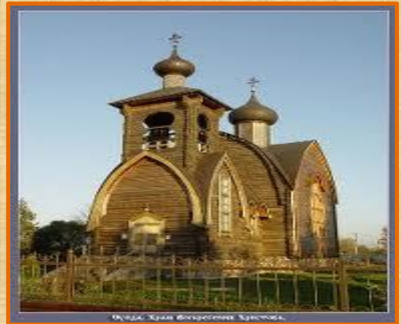
Суйда. Храм Богородицы. С. Суйда.