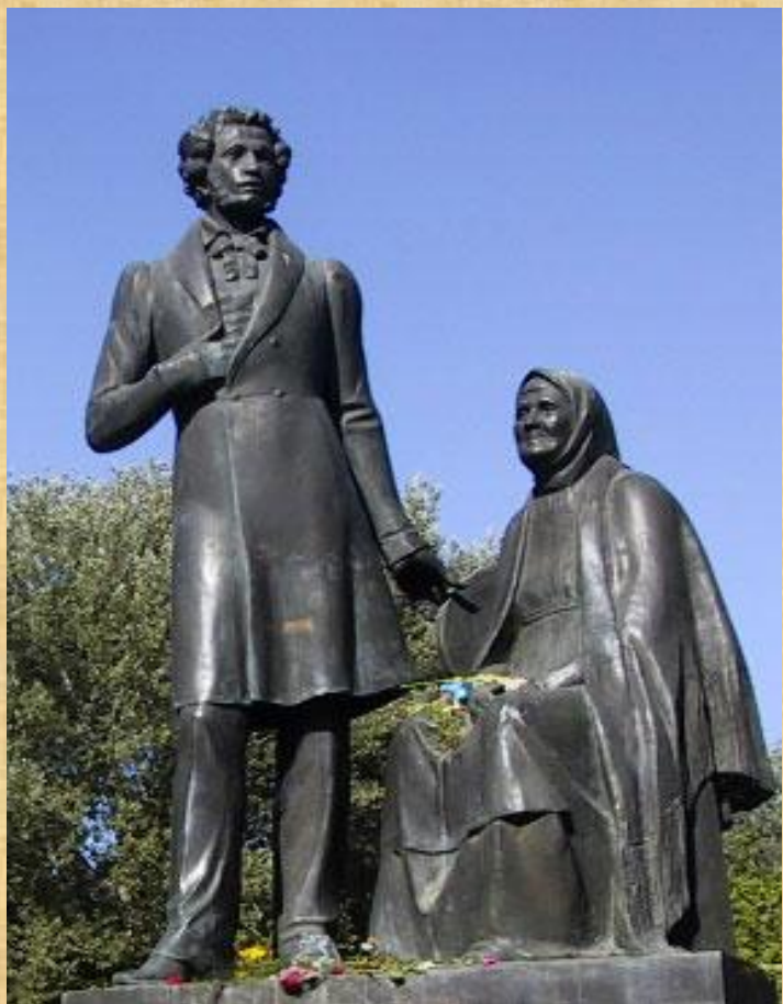
В городе Псков