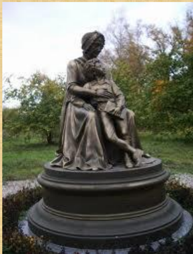
В селе Воскресенское Гатчинского района