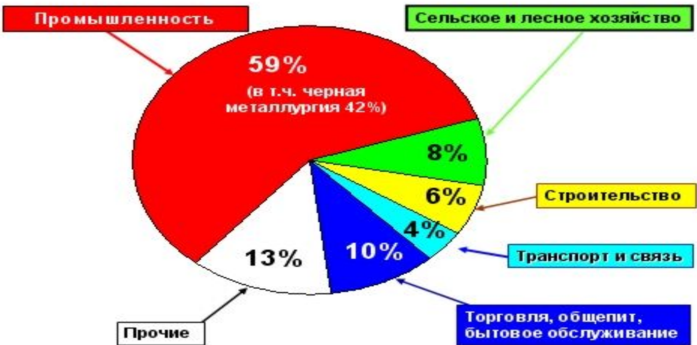
Структура ВРП Липецкой области в 2007г (%)

Основной экономический потенциал Липецкой области – промышленность, на ее долю (по данным 2007 года) приходится 59% всего объема производства. Основу промышленности составляют 75 крупных и средних предприятий, относящихся к черной металлургии, машиностроению, электроэнергетике, пищевой, химической, легкой промышленности и промышленности строительных материалов. Ведущее место занимает продукция черной металлургии и машиностроения, удельный вес которых, в общем объеме выпускаемой промышленной продукции, составляет 42% и 14% соответственно.