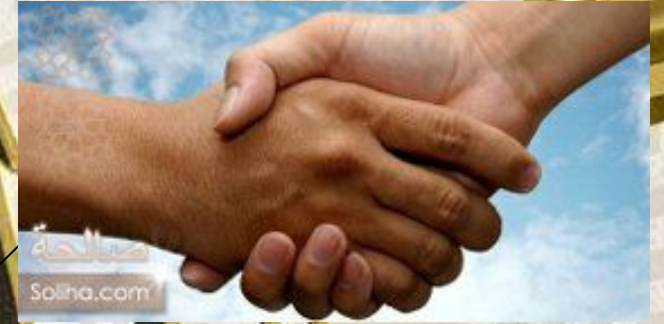
Көмектесу, қол алысып амандасу - сунна