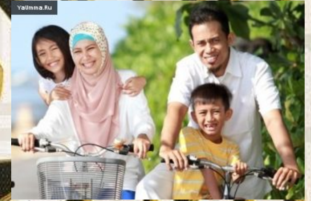
Отбасына камқорлық жасау - сунна