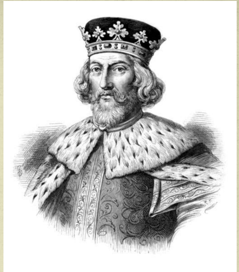
Иоанн Безземельный (1199-1216)