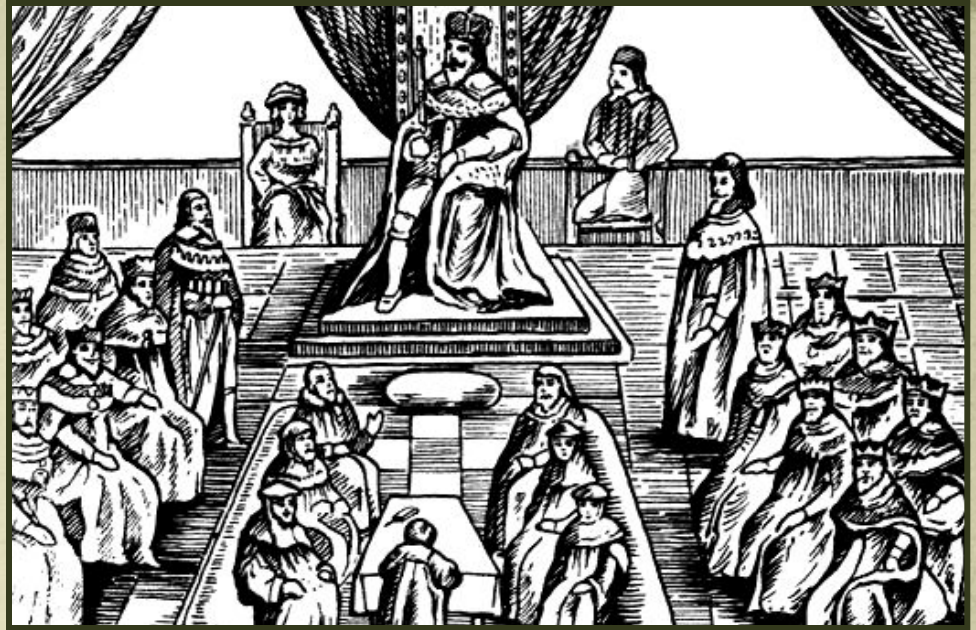
Палата лордов. Средневековая гравюра.