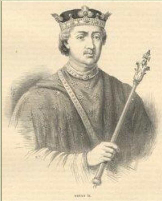
Генрих II Короткий Плащ