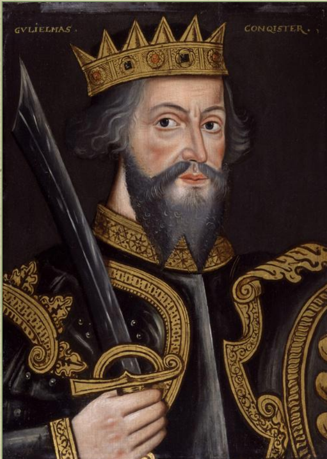
Вильгельм I Завоеватель