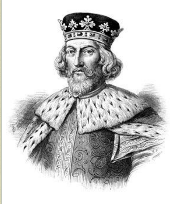
Иоанн Безземельный (1199-1216)