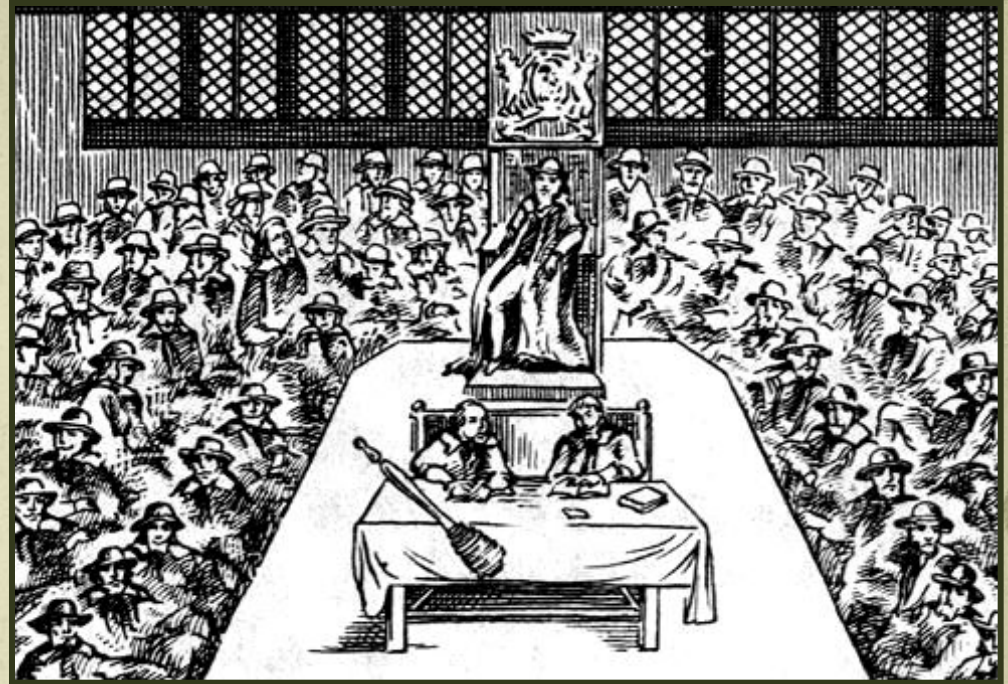
Палата общин. Средневековая гравюра.