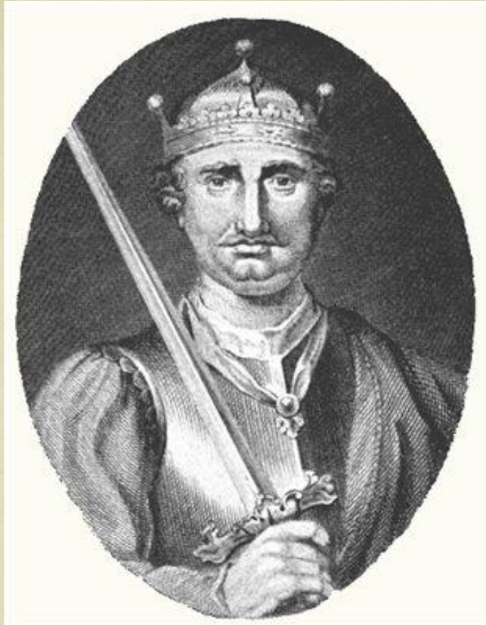
Вильгельм Завоеватель (1027(28) - 1087)