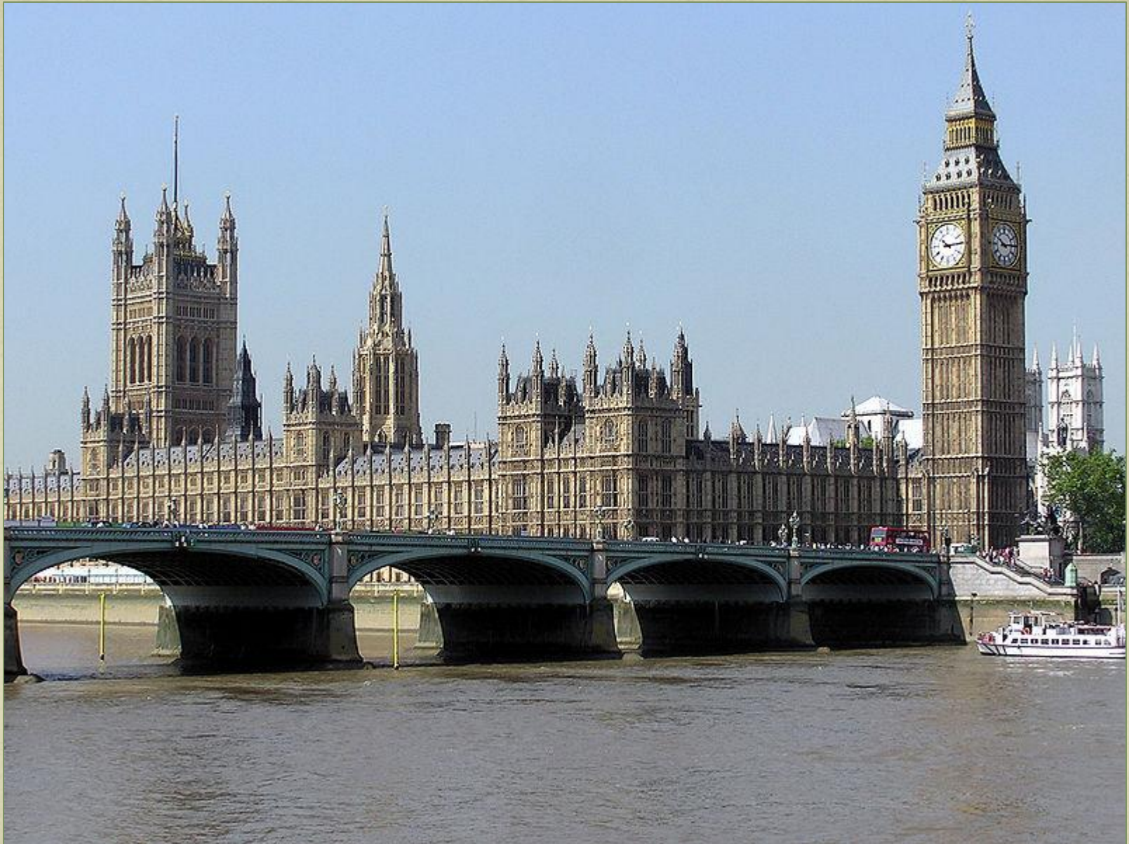
Здание Парламента (Вестминстерский дворец)