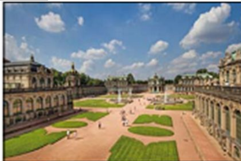
Национальная картинная галерея. Дрезден