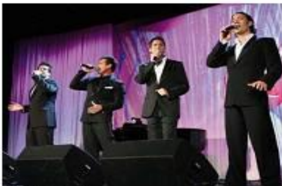
«El Diva». Кларсон «Детская юбка Бланка»