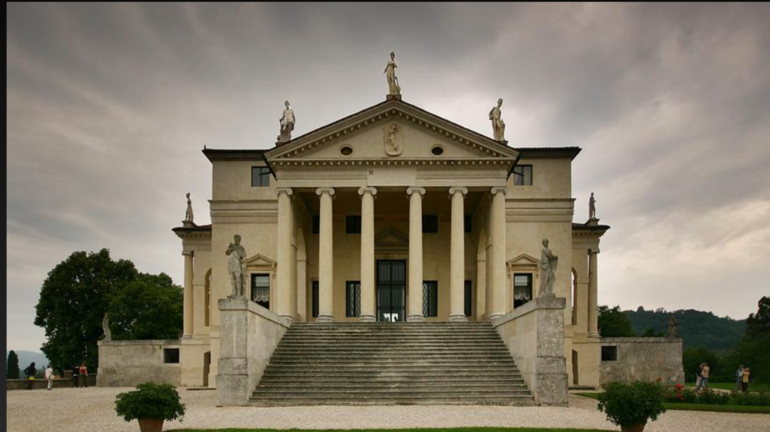
Андреа Палладио. Вилла Ротонда близ Виченцы

(от лат. classicus – образцовый), стиль и направление в литературе и искусстве XVII – начала XIX веков, обратившиеся к античному наследию как к норме и идеальному образцу. Классицизм сложился в XVII веке во Франции, отразив подъем абсолютизма.