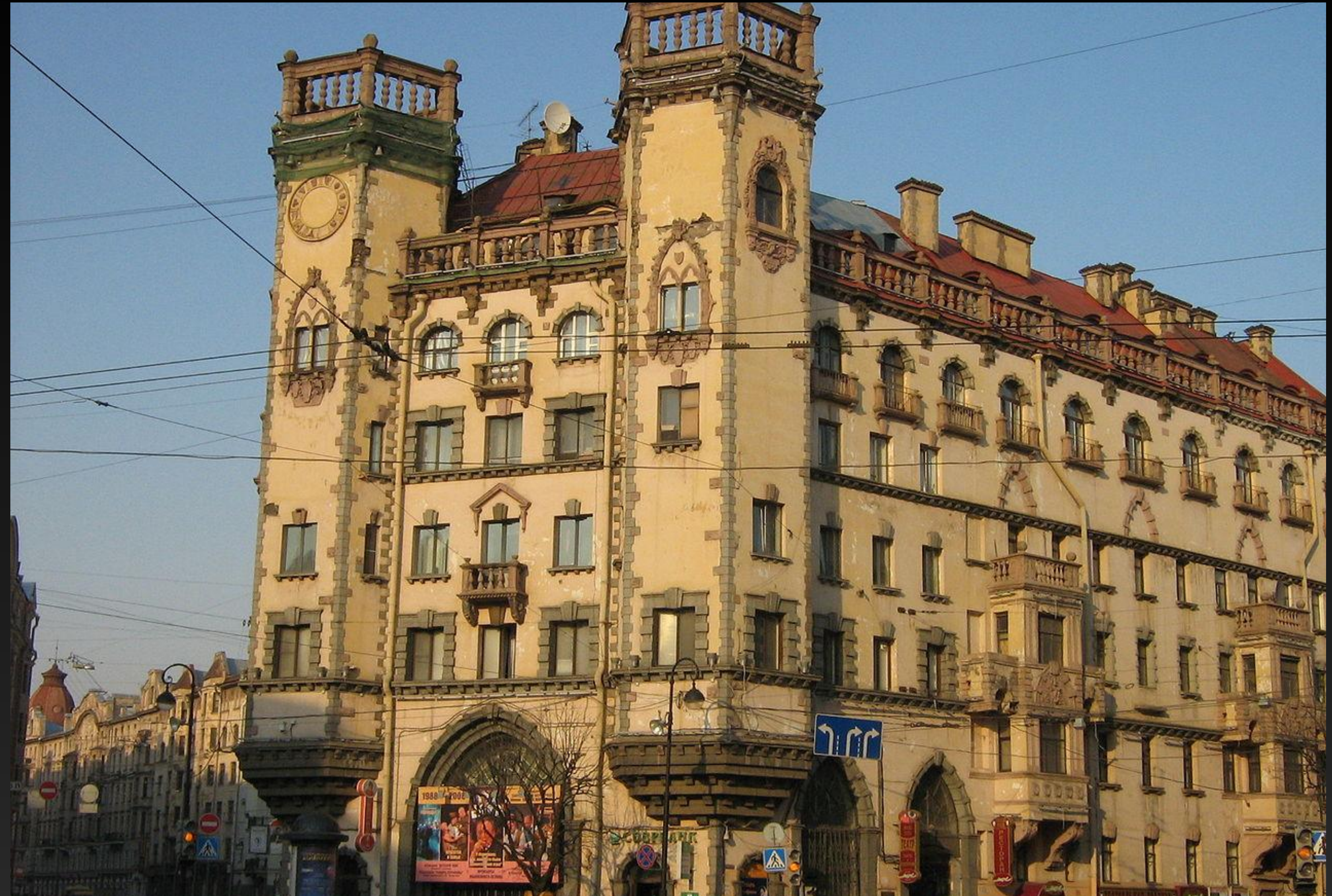
«Дом с башнями» на площади Льва Толстого в Санкт-Петербурге

(франц. neo-classicisme), общее название художественных течений, основывавшихся на классических традициях искусства античности. Классические традиции часто противопоставлялись индивидуалистическому произволу (в XX веке арх. О. Пере во Франции, П. Беренс в Германии, И.В.Жолтовский, И.А. Фомин в России). В фашистских Италии и Германии неоклассицизм был объявлен официальным стилем. Неоклассицизмом часто называли также классицизм XVIII – начала XIX веков, в отличие от классицизма XVII века.