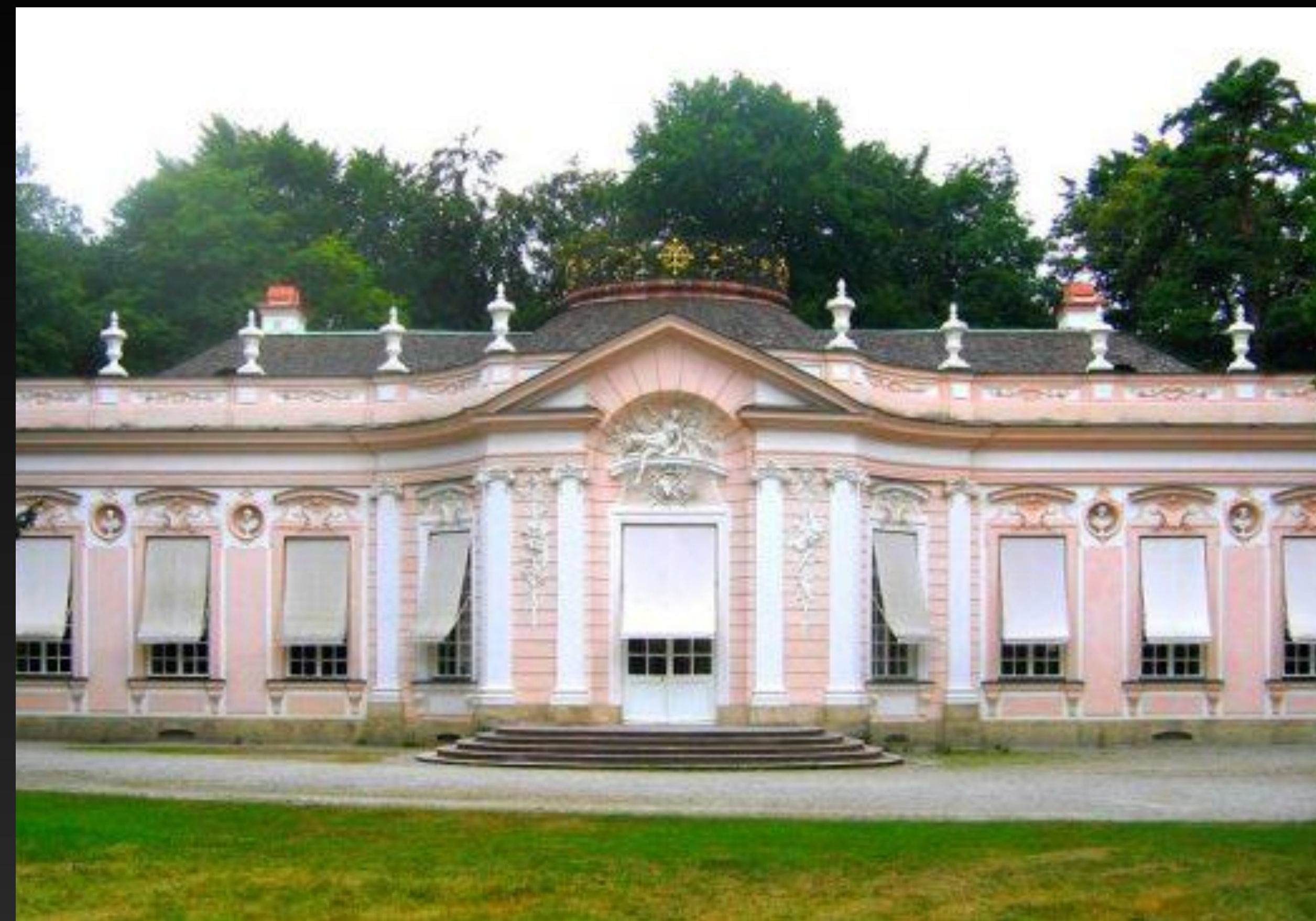
Французское рококо: Амалиенбург под Мюнхеном.

(франц. Rococo, от rocaille – декоративный мотив в виде раковины), стилевое направление в европейском искусстве 1-й половины XVIII века. Для рококо, связанного с кризисом абсолютизма, характерен уход от жизни в мир фантазии, театрализованной игры, мифических и пасторальных сюжетов, эротических ситуаций. В искусстве рококо господствует грациозный, прихотливый орнаментальный ритм. Скульптура и живопись — изящны, декоративны, но неглубоки. Декоративное искусство принадлежит к высшим достижениям искусства XVIII века по изысканности, декоративной красоте асимметричных композиций, по духу интимности, комфорта и внимания к личному удобству.