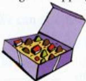
a box of chocolates