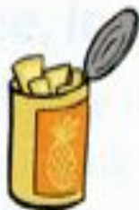
a tin of fruit