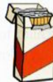
a packet of cigarettes