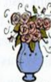
a vase of flowers