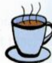
a cup of coffee