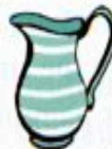
a jug of milk