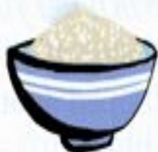
a bowl of sugar