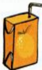
a carton of orange juice