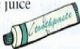
a tube of toothpaste