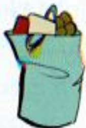
a bag of shopping