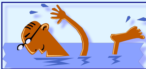
купание в водоеме