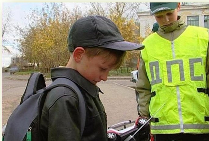
Тебя ждут дома, малыш!