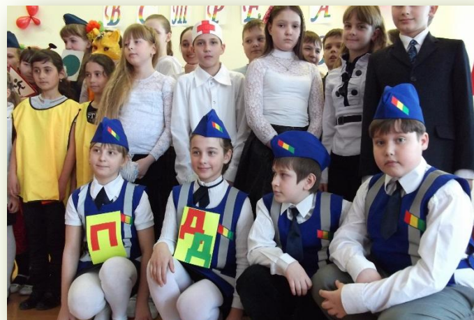
Встреча отрядов ЮИД, 2014 год