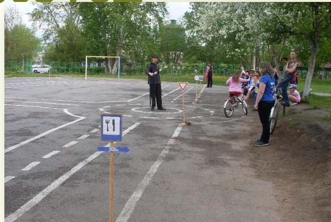
Занятия в велогородке