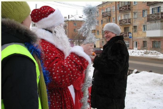
Рейд «Новогодние наставления Деда Мороза»