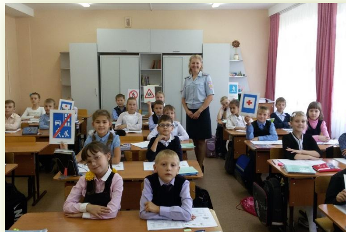
Встреча в рамках проекта «Правила ГАИ – правила твои», 2016 год