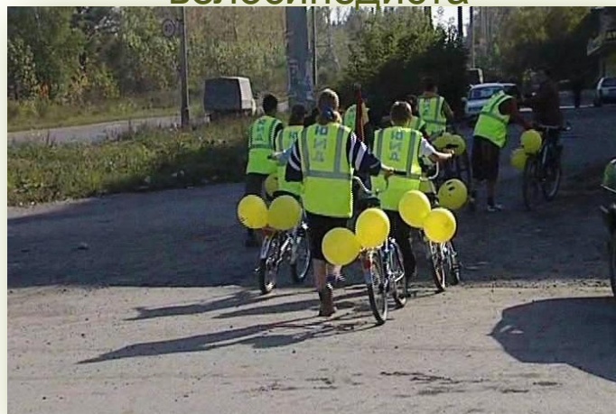
Первый велопробег по улицам города