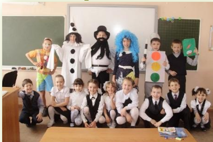
Проект «Театр Карабаса Барабаса в гостях у ребят первого