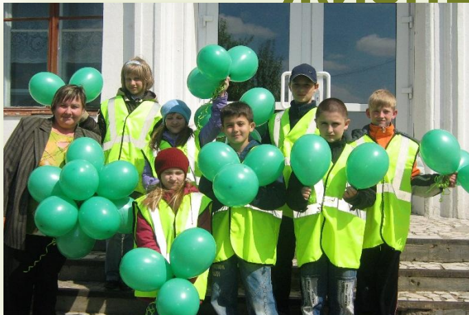
Акция «Зелёный огонёк»