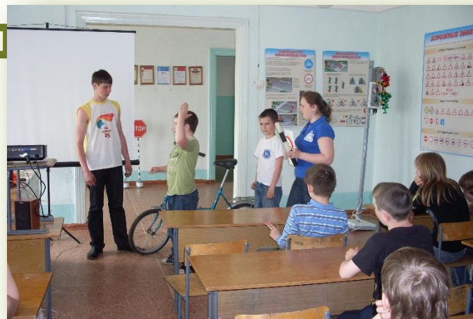
Сигналы поворота велосипедиста