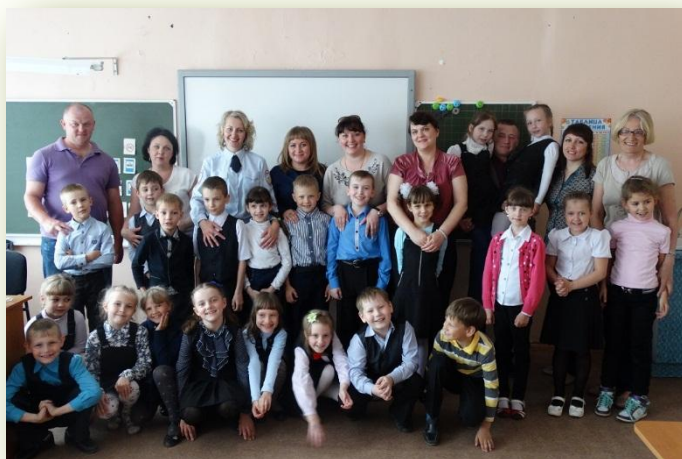
Игра с родителями, 2015 год