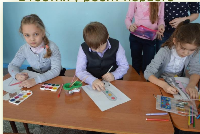
Мероприятие в рамках проекта, 2016 год