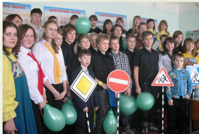
Обмен мнением: Россия - Швеция