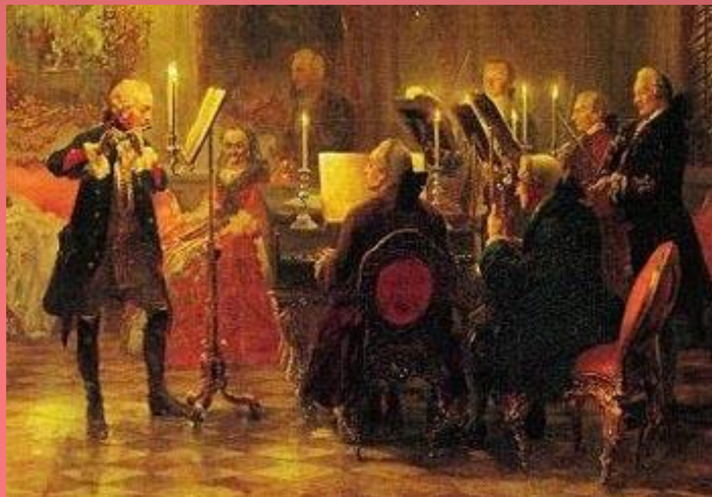
А. Менцель Флейтовый концерт 1852 г.