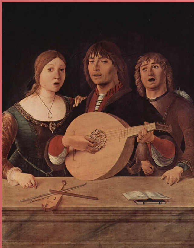
Эрколе де Роберти Концерт 1490 г.