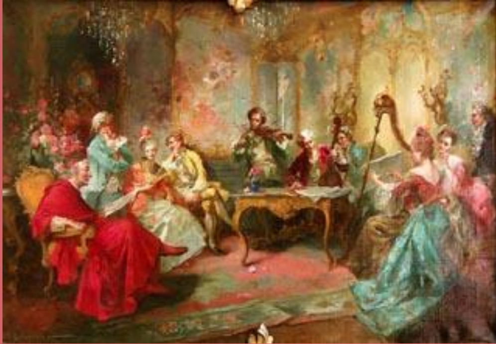
Р. Гинкур «Концерт» 1894 г.