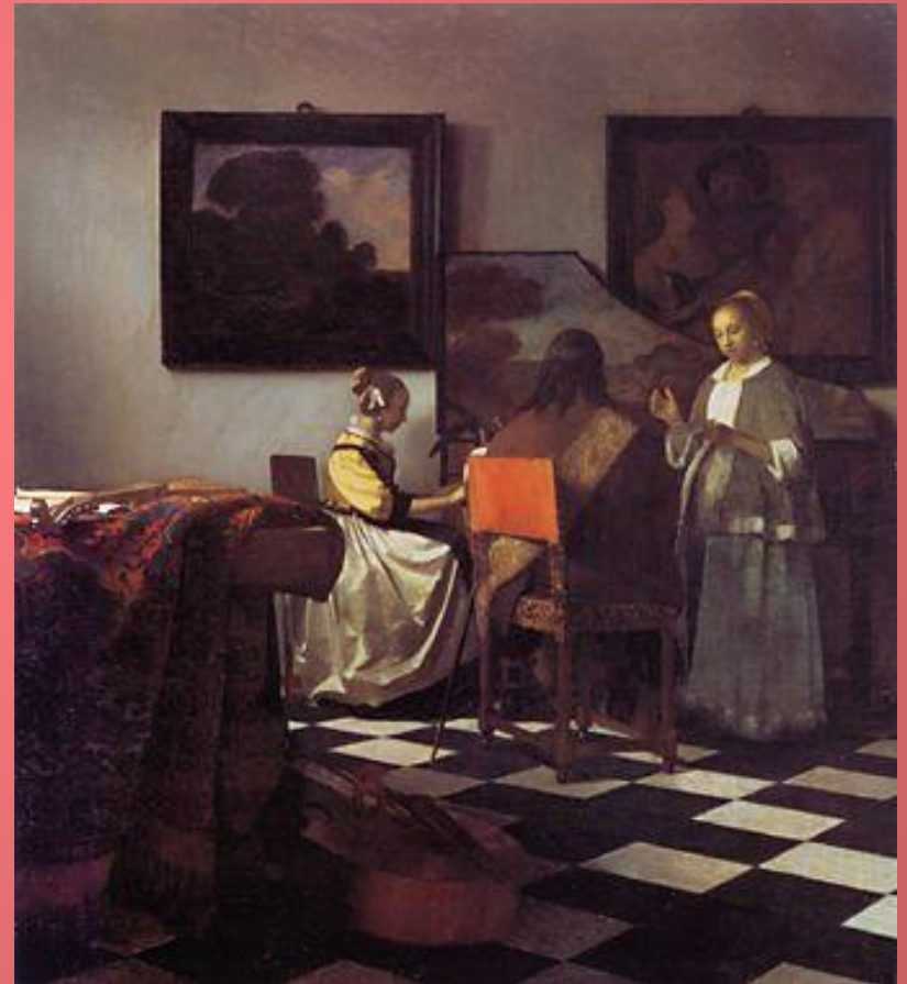
Я.Вермеер «Концерт» 1665 г.