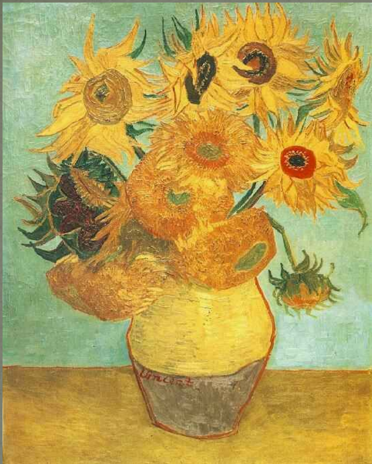
Винсент Ван Гог «Подсолнухи»