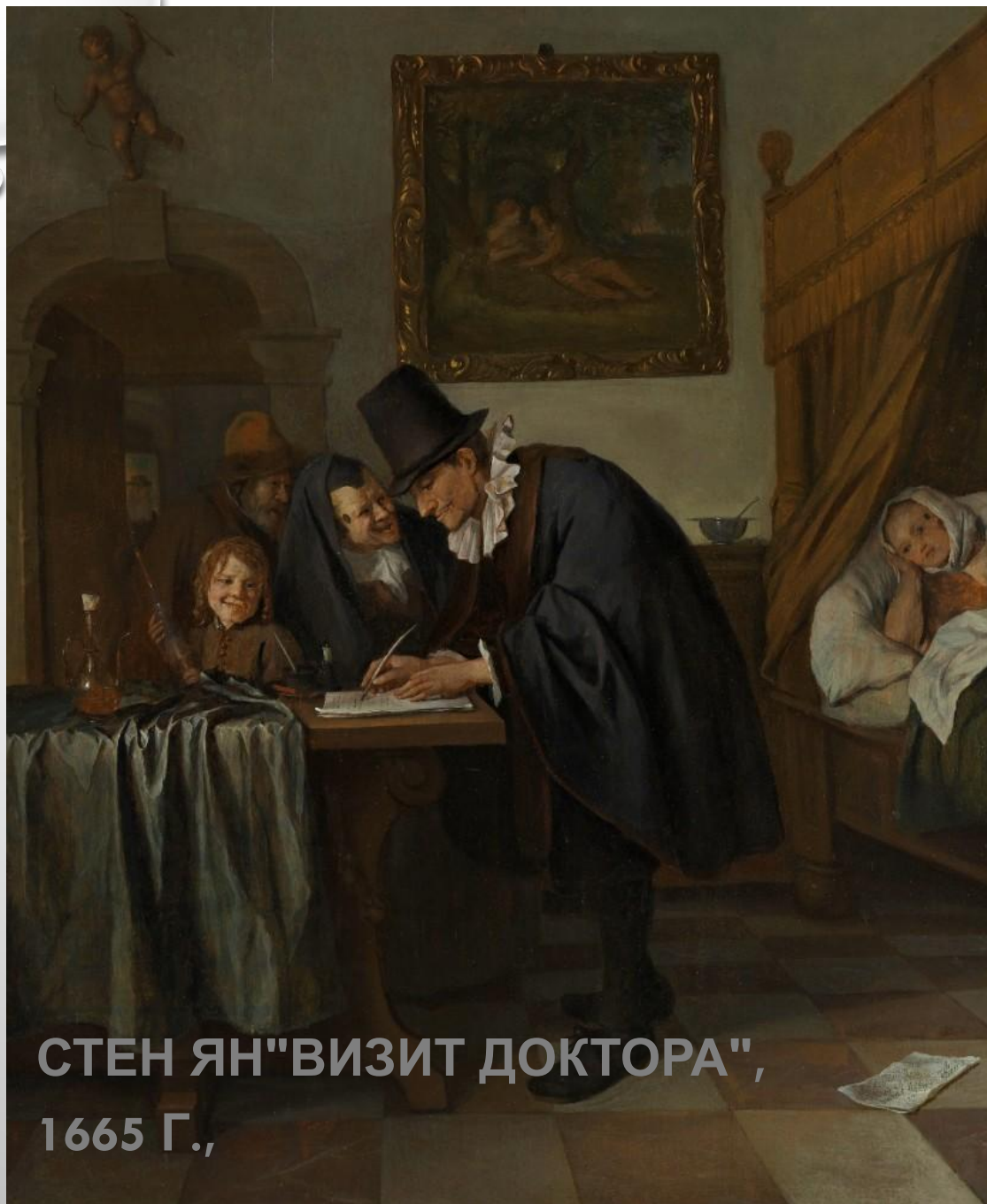
СТЕН ЯН "ВИЗИТ ДОКТОРА", 1665 Г.,