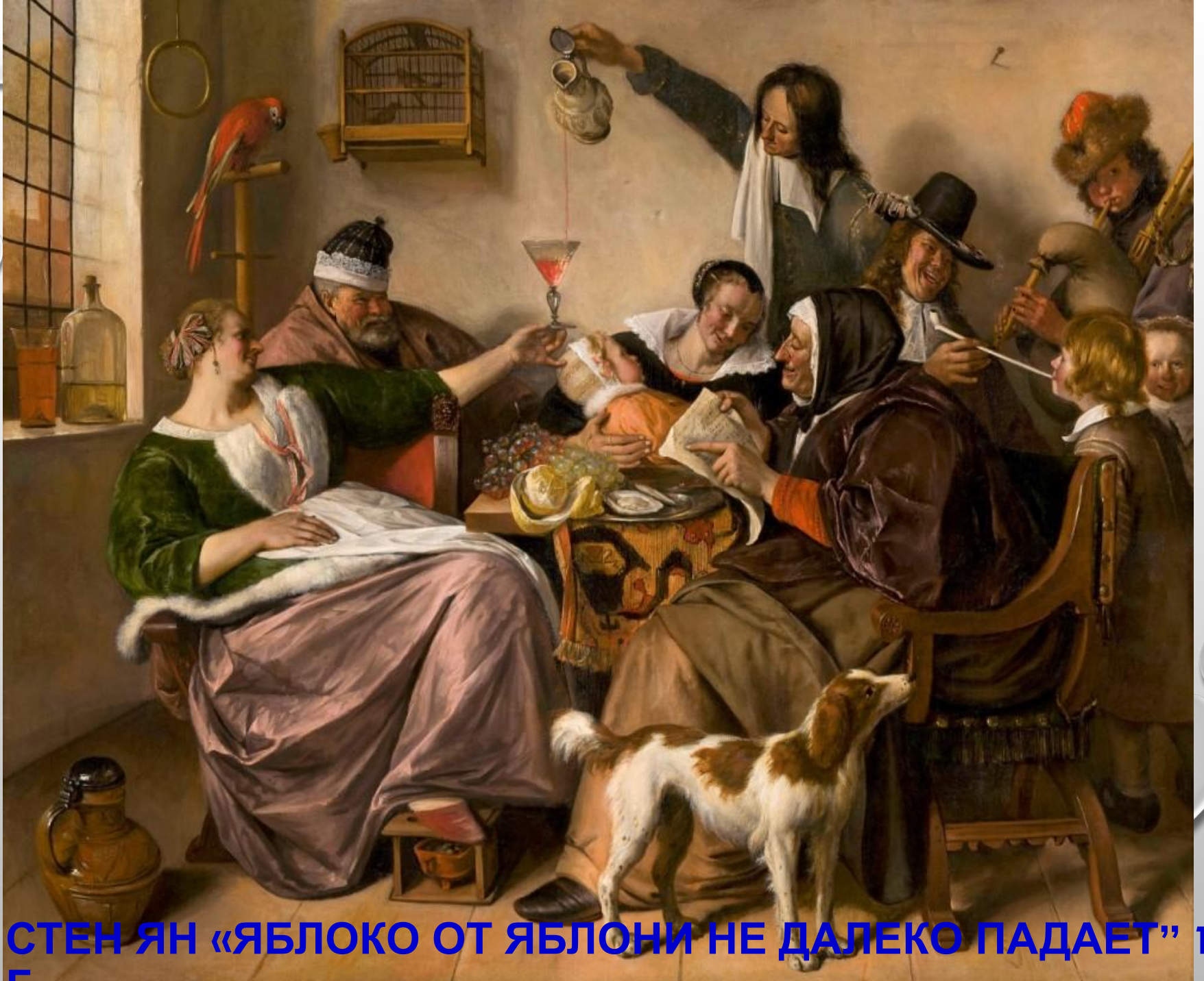
СТЕН ЯН «ЯБЛОКО ОТ ЯБЛОНИ НЕ ДАЛЕКО ПАДАЕТ» 1666