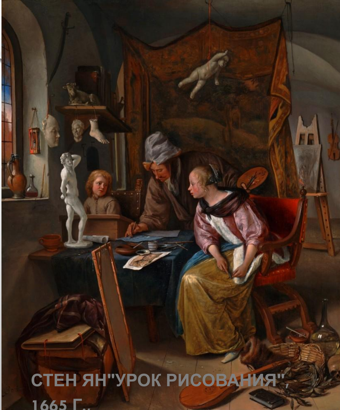
СТЕН ЯН "УРОК РИСОВАНИЯ", 1665 Г.,