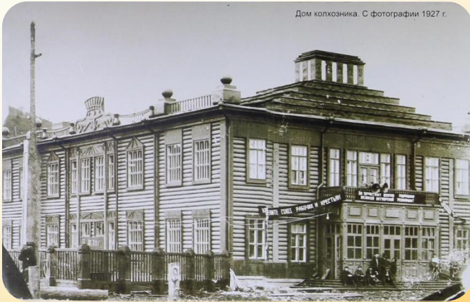
Дом колхозника. С фотографии 1927 г.

История учреждения культуры в городе началась в 1925 году.