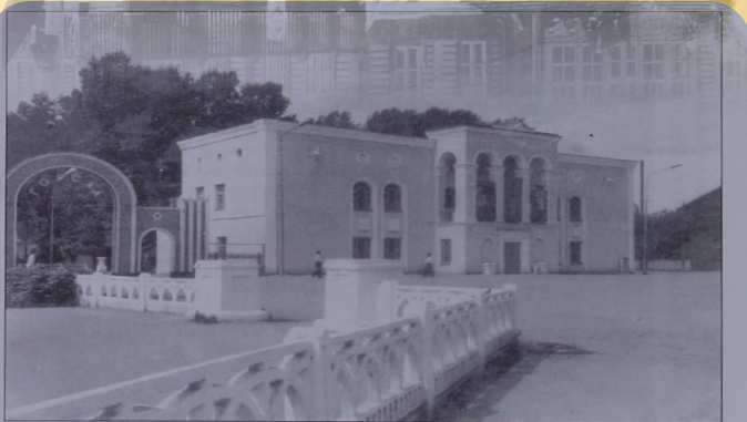
В 1950 году здание национального колхозно-совхозного театра передано для организации городского Дома культуры. Более 50 лет он остается сосредоточием культурной жизни не только города, но и всей области, а затем и республики.

В 1930 году строительство Дома Ленина было завершено. Однако весной 1931 года в нем случился пожар, позднее на его месте построено здание первого областного колхозного национального театра (Дом колхозника).