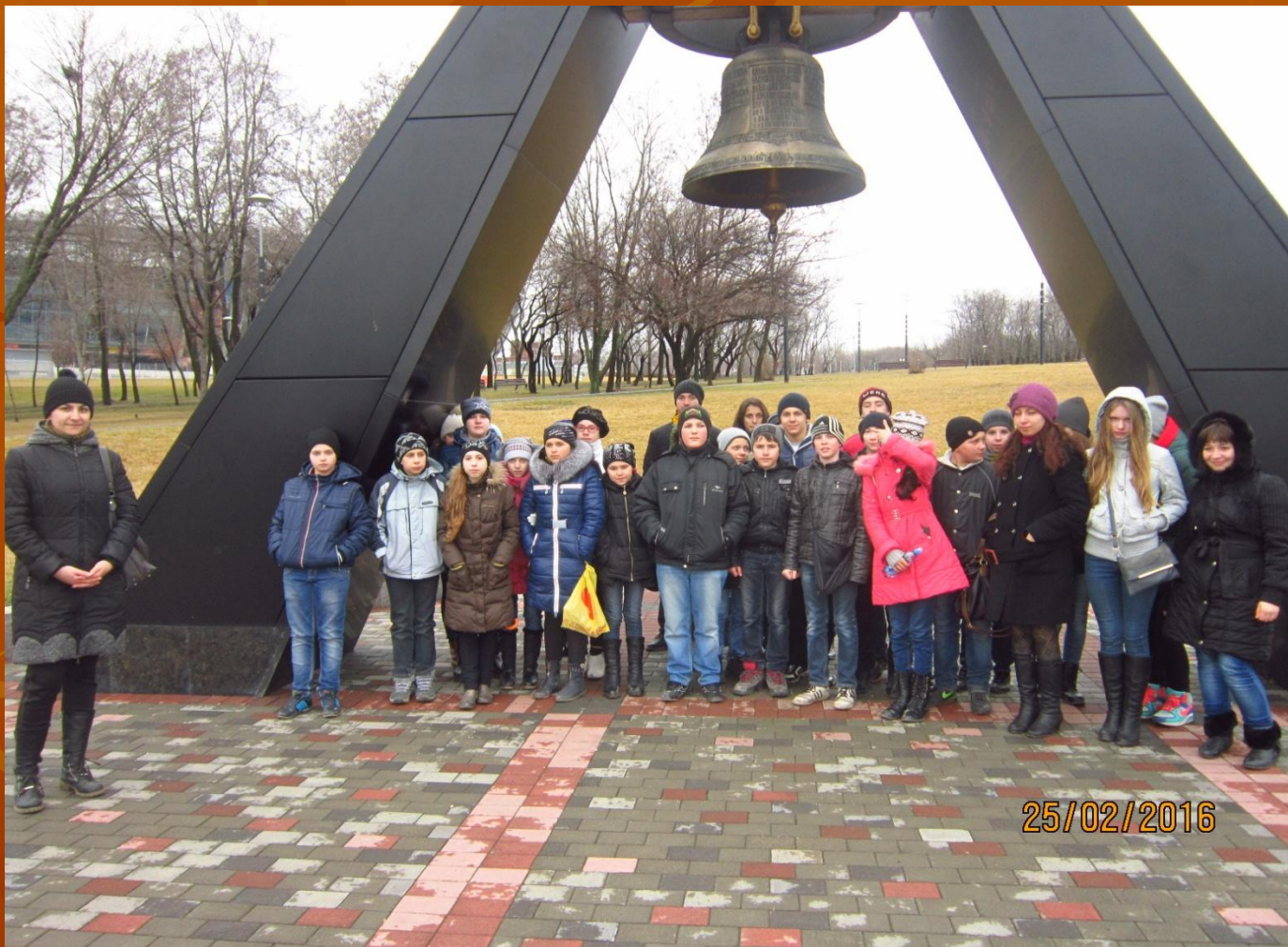
«Памяти жертв фашизма» в парке Ленинского Комсомола