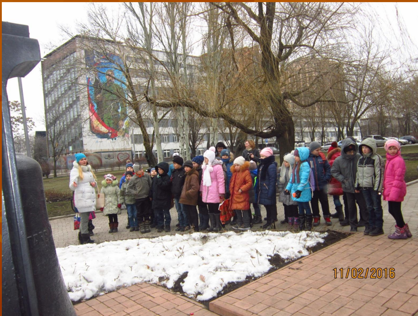
«Кованая сказка» в Парке кованых фигур