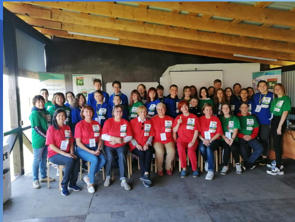
Бизнес конференция на базе Международный аэрокосмической школы в д. Калиновка Давлекановского района