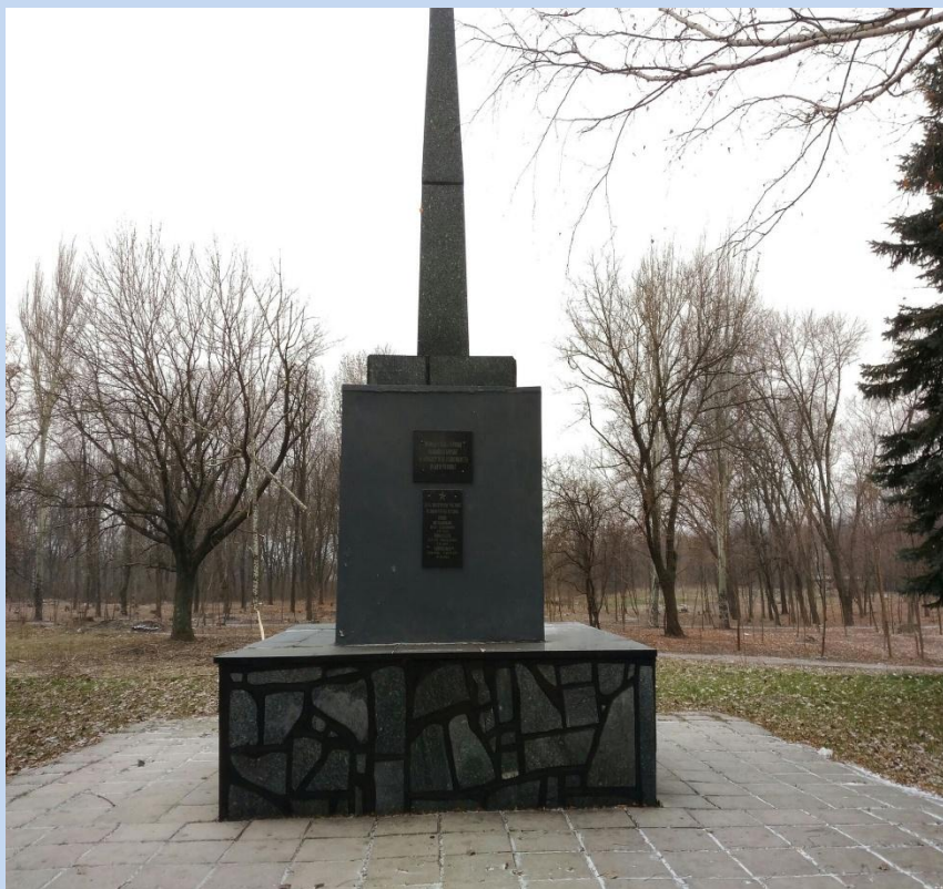
Памятник в парке имени Воровского