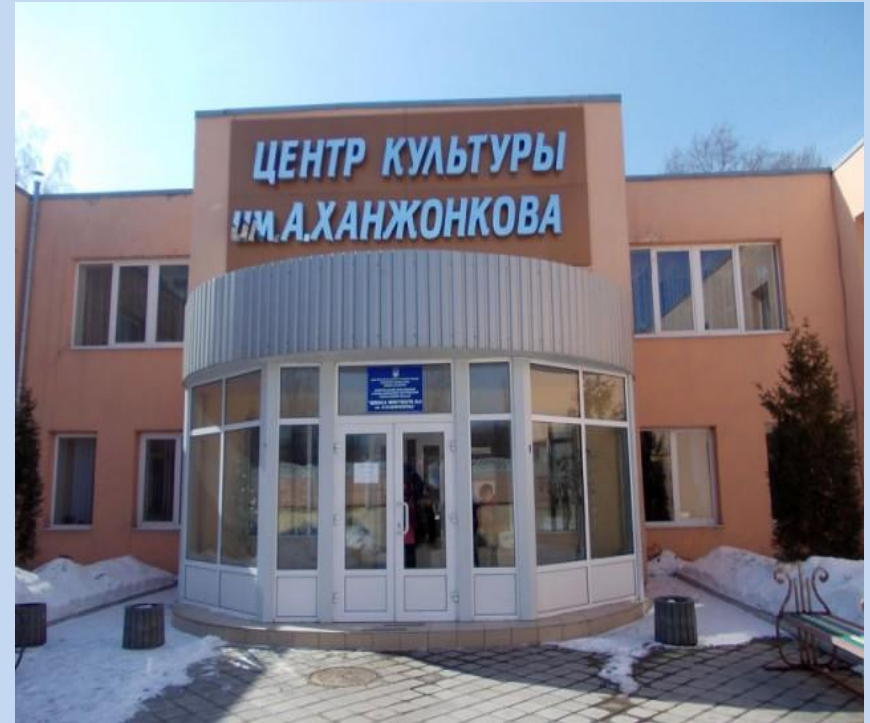
Центр культуры имени А. А. Ханжонкова

Своё название наш посёлок получил благодаря Александру Алексеевичу Ханжонкову, одному из основных создателей звукового кино. Наш земляк обеспечил прокат русских фильмов, стал известным всей России.