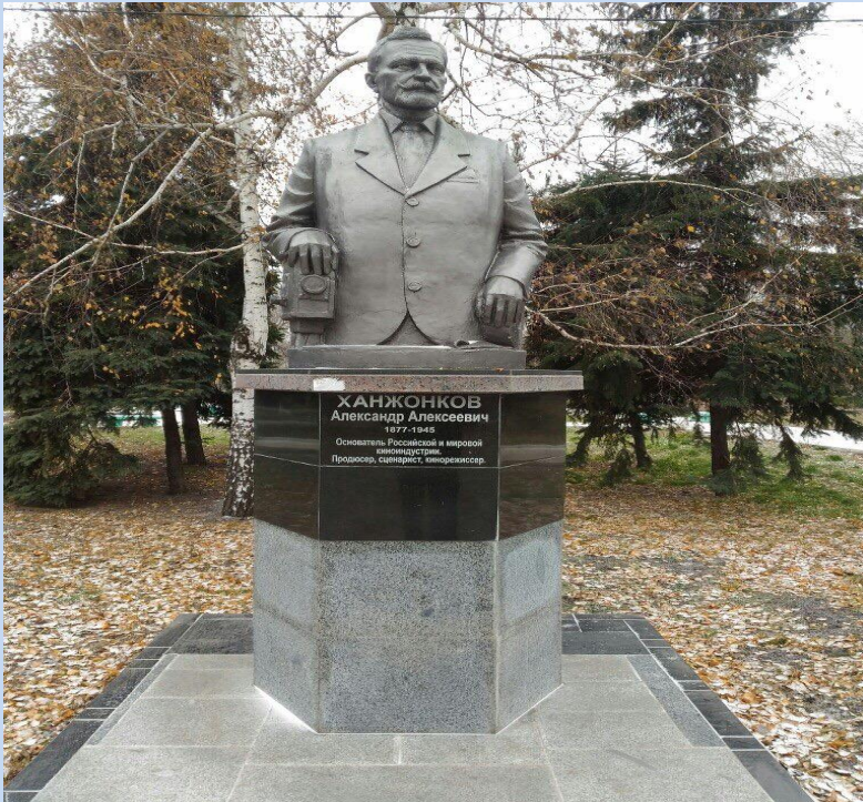
Памятник А. А. Ханжонкову