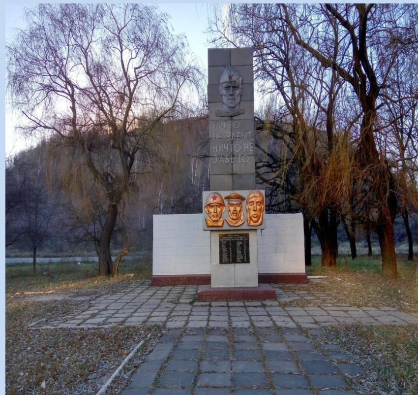
Памятник в сквере шахты 13 – «бис»

В нашем посёлке чтят память героев Великой Отечественной войны.