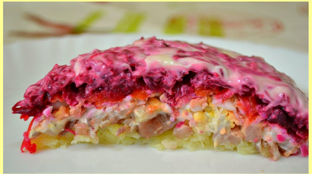
СЕЛЕДКА ПОД ШУБОЙ