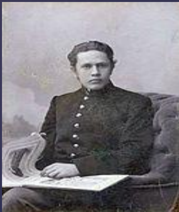
Алексей Николаевич Толстой