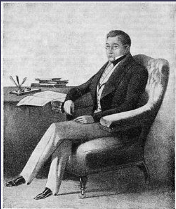
Александр Сергеевич Грибоедов