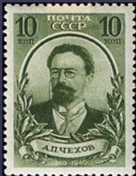
АНТОН Павлович Чехов