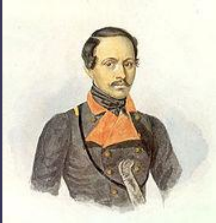
Михаил Юрьевич Лермонтов