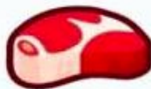
Крольчатина Телятина Курятина