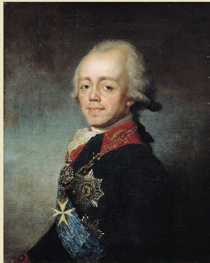
Павел I (1754—1801)