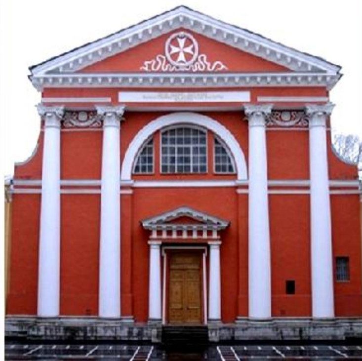
Мальтийская капелла 1798-1800 г. Архитектор Д. Кваренги