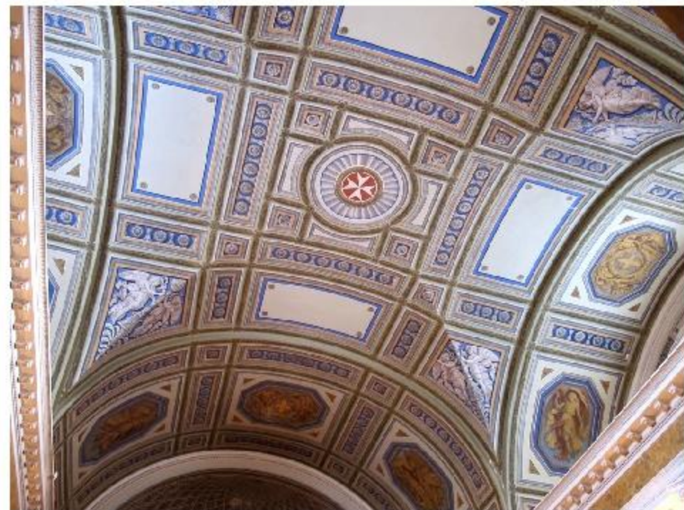
Духовно-рыцарский орден св. Иоанна Иерусалимского