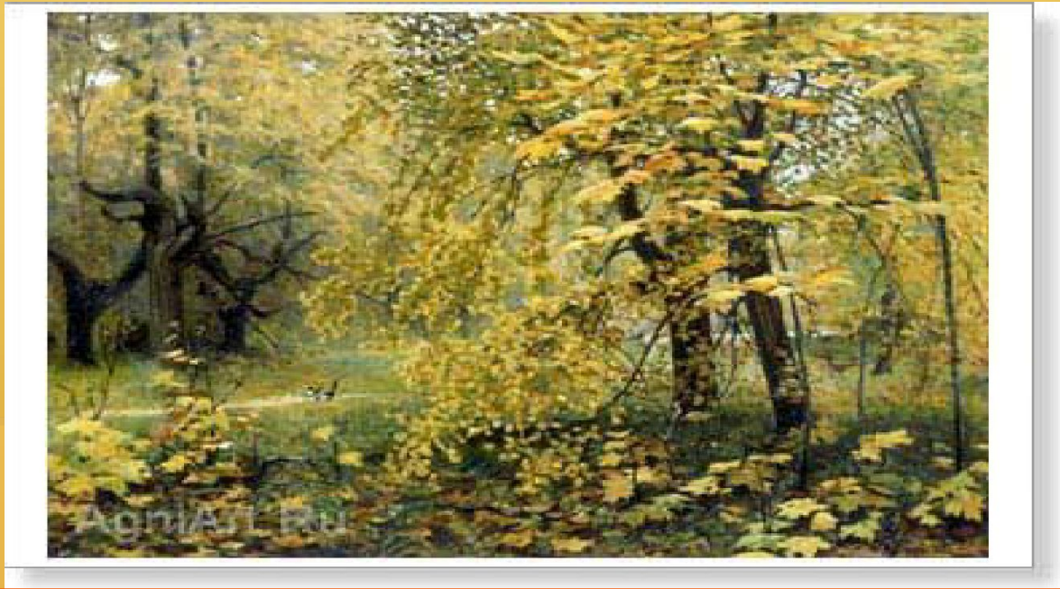
И. С. Остроухов «Золотая осень».

Музыка П.И.Чайковского «Времена года», «Осень»