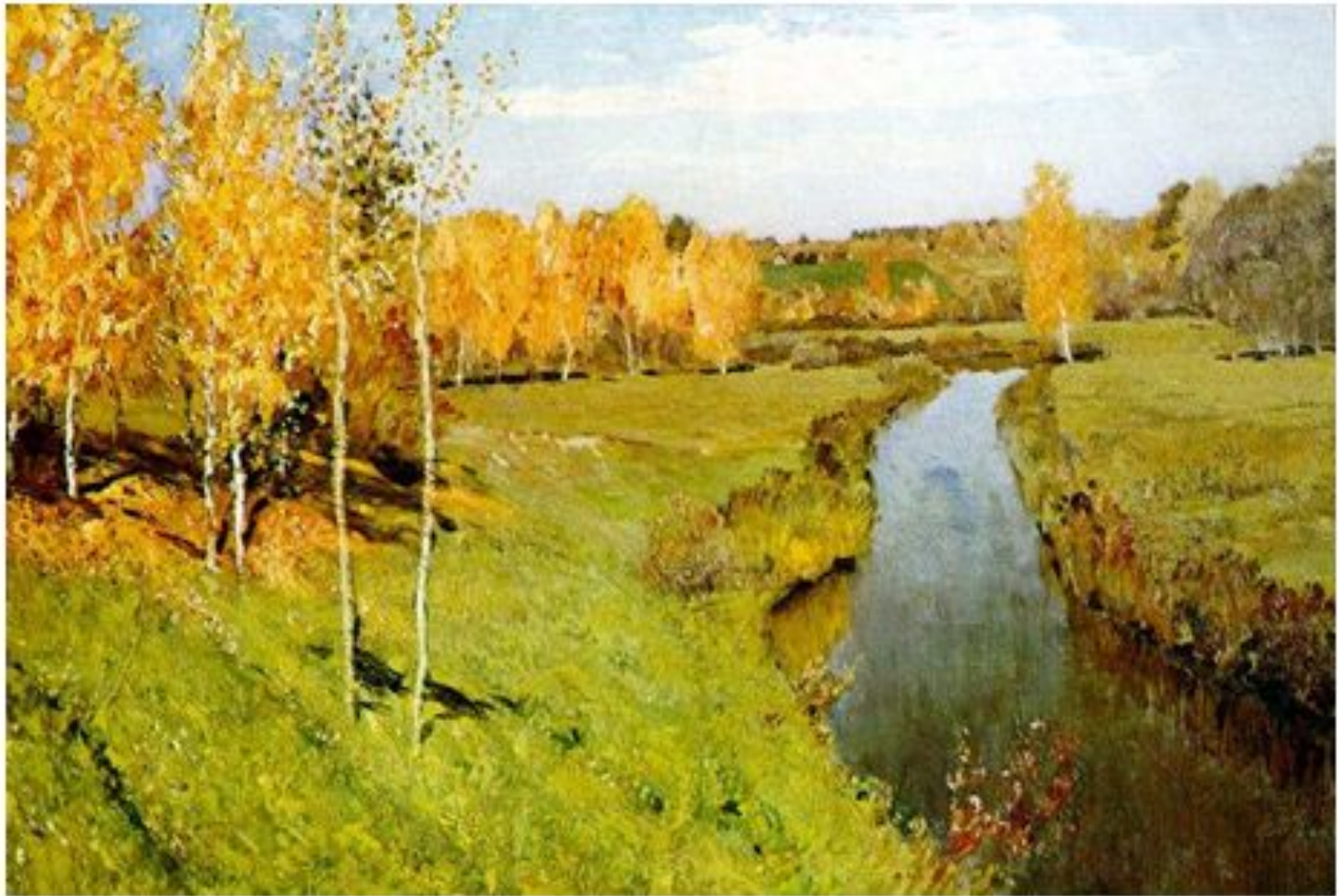
Золотая осень.Исаак Левитан